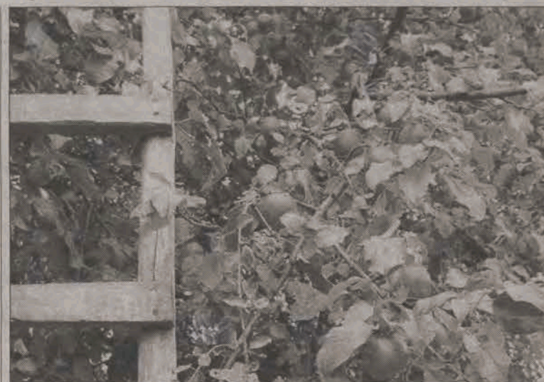
Stare, ale mają swój niepowtarzalny urok

W najbliższą niedzielę, 8 października, Regionalne Centrum Krwiodawstwa i Krwiolęcznictwa z Łodzi organizuje w Strykowie zbiórkę krwi. Honorowi krwiodawcy będą mogli zgłaszać się do przychodni przy ul. Kościuszki w godzinach od 10.00 do 13.00. Powinni być zdrowi i mieć przy sobie dowód tożsamości. (ljs)