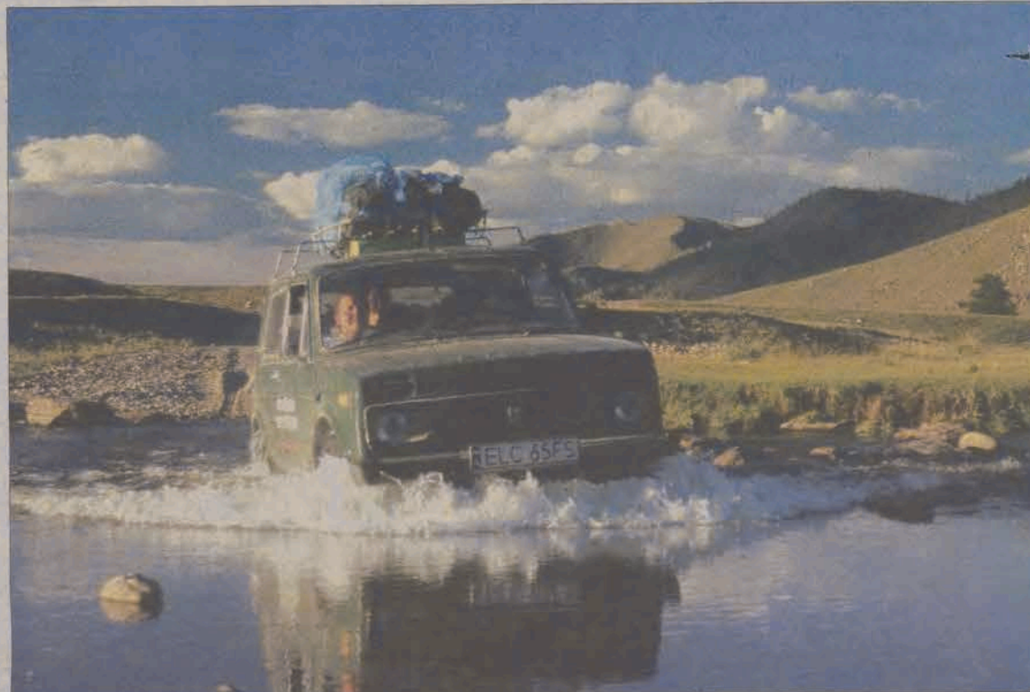
Przeprawa przez jedną z wielu rzek na mongolskich stepach.

Z Altaju 1000 km jechali pagórkowatym stepem porośniętym jedynie trawą. Co jakiś czas mijali jeziora, w tym największe w Mongolii słone jezioro Ubs, przejeżdżali przez rzeki, a nawet bagna. Mijali wolno pasące się konie, wielbłądy i zwierzęta hodowlane. - Nie brakowało jednak i dzikich