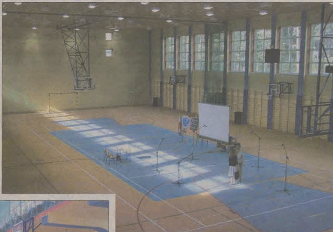
Widok głównej płyty hali z galerii dla widzów.

Niemal do ostatniej chwili trwały poprawki. Konieczne okazało się np. przemalowanie linii wyznaczających boisko