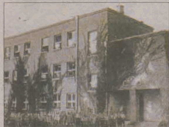
Tak prezentowała się „Dwójka” w starym jeszcze budynku A tak wygląda SP2 dziś