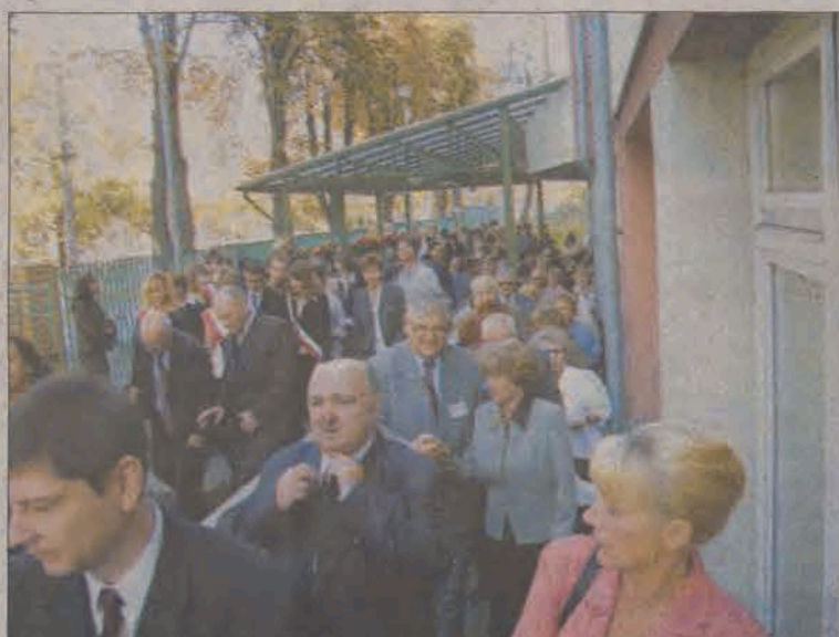
Blisko pół tysiąca absolwentów szkoły, z różnych lat i zakątków Polski - to robi wrażenie.