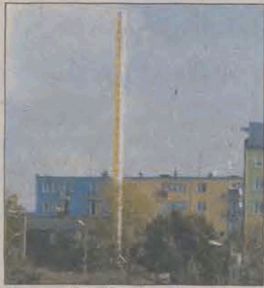
Z początkiem tego tygodnia z nowego komina kotłowni poleciał dym.