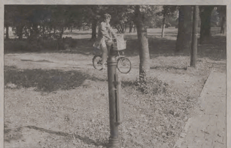
Część koszy została skradziona, a część zdemontowana przez MZK celem przeprowadzenia naprawy.

Każda taka szyba to koszt 300 zł, a zatem koszt zakupu czterech takich szyb to 1.200 zł z budżetu miejskiego. Za „rozrywkę” wandalu placą tym samym wszyscy mieszkańcy Głowna. Kosze na śmieci niszczony są notorycznie w rejonie zalewu i parkingu miejskiego przy Górcie Kapusty. Z tego ostatniego zniknęła też większość