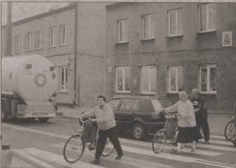
Mieszkańcy ul. Warszawskiej żądają odszkodowań