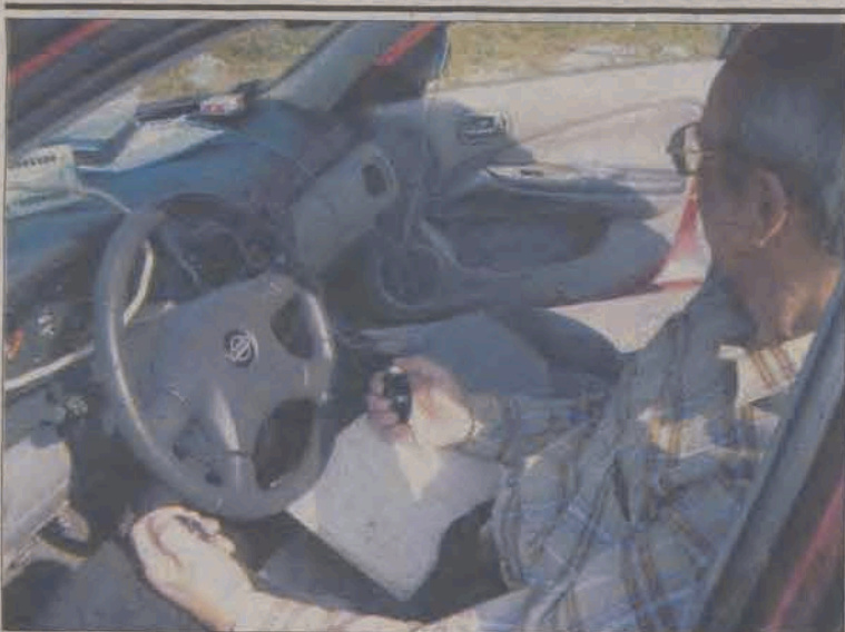
Pomiary natężenia ruchu w Strykowie dowiodą, na co rzeczywiście narażeni są codziennie mieszkańcy tego miasta.

zystwa Miłośników Astronomii opowiadał anegdoty astronomiczne i uczył jak rozpoznawać poszczególne gwiazdozbiory i obiekty na niebie, takie jak Wielki i Mały Wóz, Gwiazda Polarna, Droga Mleczna czy Ogon Łabędzia. Ze względu na to, że każdy obiekt chciał obejrzeć tak wiele osób, nie starczyło już czasu na prelekcję połączoną z prezentacją multimedialną. dok. na str. 5