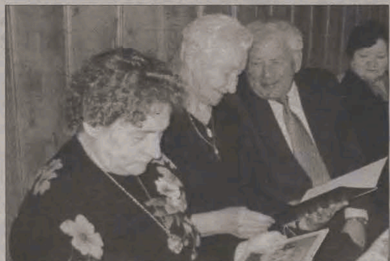
Grono pogodnych seniorów ze Strykowa lubi spotykać się przy każdej okazji, a ten październik będzie w nie obfitował

Weryfikacji zgłoszeń dokona komisja rekrutacyjna Centrum Samorządności i Regionalizmu w Łowiczu. Po zakończeniu przyjmowania formularzy, zostanie wyłoniona lista osób, które zakwalifikowały się do udziału w projekcie. Powiadomienie o rozstrzygnięciu rekrutacji otrzymają tylko osoby, które się zakwalifikowały. W sytuacji większej ilości zgłoszeń niż dostępnych miejsc, o zakwalifikowaniu będzie decydować kolejność zgłoszeń. Pozostałe osoby zostaną wpisane na listę rezerwową. Realizacja projektu potrwa do lipca przyszłego roku. (ljs)