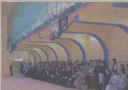
Widownia pomieścić może 380 widzów.

główne, bo w wytycznych określono je kolorem niebieskim, ale nie wzięto pod uwagę tego, że niebieska będzie również nawierzchnia boiska. Przed uroczystym otwarciem pasy przemalowano i teraz