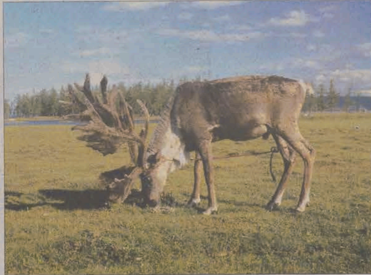
Renifer nad jeziorem Chubsugul.

nie jednak od wyznania, mieszkańcy Mongolii są bardzo przyjaźnie nastawieni do turystów. Zawsze uśmiechnięci, chętnie zapraszają do swoich jurt i pomagają w potrzebie. Członkowie wyprawy mieli możliwość doświadczenia tej gościnności, mieli dzięki temu okazję przekonać się, że Mongołowie utrzymują się głównie z hodowli owiec, jaków i baranów. Są ciągle doskonałymi jeźdźcami, choć w dzisiejszych czasach większość z nich przesiadła się z konia na motocykl. W jurtach spotyka się światło elektryczne i telewizory, które zasilane są bateriami słonecznymi. Choć Mongolia wydaje się odległym, egzotycznym krajem, to nitką łączącą ich z Polską i Łowiczem okazały się produkty firmy „Bracia Urbanek” spotykane praktycznie w każdym mongolskim sklepie oraz logo firmy widziane nie raz na samochodach i tablicach reklamowych.