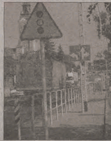
Chodnik czy tor do biegu z przeszkodami?

Z tym fantem musi teraz walczyć gmina, upominając się o należyte wykonanie lub odtworzenie chodników w Generalnej Dyrekcji Dróg Krajowych i Autostrad. Ta ostatnia przyznaje rację. Na razie zapowiedziała, że nie dokona odbioru technicznego odcinka 350m przy ul. Warszawskiej, dopóki nie zostanie on ułożony przez wykonawcę w należyty sposób. (ljs)