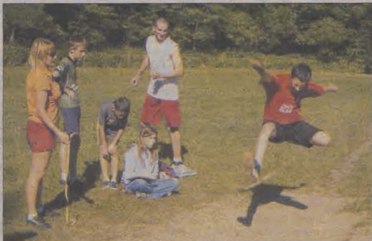
Chętnych do udziału w sportowych zawodach nie brakowało.