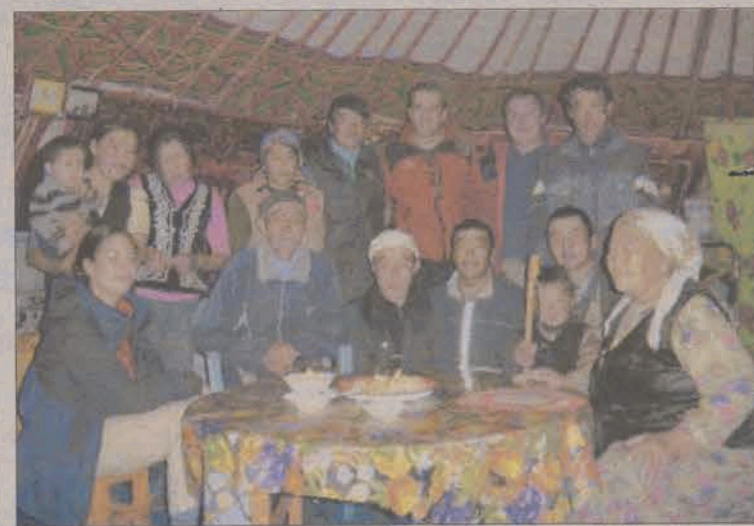
Uczestnicy wyprawy gościnnie przyjmowani w mongolskiej jurcie.