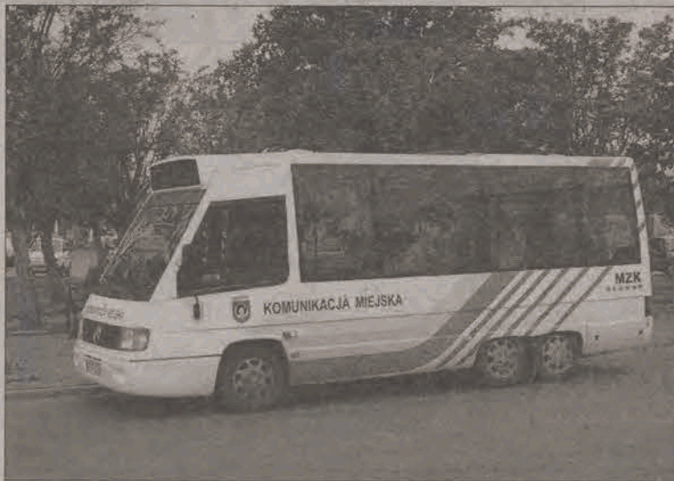
MERCEDES JUŻ NA TRASIE. W tym tygodniu na trasie komunikacji miejskiej w Głownie pojawił się miniautobus marki Mercedes 0100 City, który Miejski Zakład Komunalny kupił w końcu sierpnia tego roku za 38 tys. zł od firmy „Erika” z miejscowości Lubcza w województwie małopolskim. Pojazd nie jest nowy, bo z 1994 roku, ale prezentuje się niezłe. Na pewno lepiej niż wysłużony pomarańczowy Autosan, w dodatku jest od „weterana” bardziej ekonomiczny. Na 100 km spala 14 litrów paliwa, podczas gdy Autosan z 1983 r. - aż 30 litrów. Miniautobus ma 29 miejsc, w tym 10 siedzących i 19 stojących. (rpm)