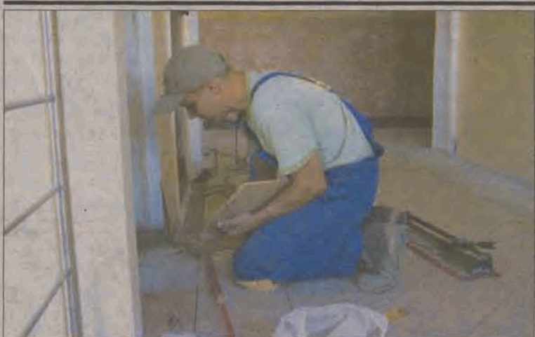
Ekipa pracuje bez przerwy, więc tegoroczny etap remontu zakończy się już w połowie października.

nu na ostatniej sesji, przeznaczając na jej realizację kwotę refundacji kosztów budowy kanalizacji sanitarnej w ul. Sikorskiego, jaka w kwocie 145 tys. zł spłynęła w końcu sierpnia do kasy miejskiej z budżetu państwa. Na remont zdewastowanej nawierzchni ul. Piaskowej miasto zarezerwowało ponad 70 tys. zł. Ile faktycznie na ten cel wyda? O tym dowiemy się już po rozstrzygnięciu przetargu na wykonawcę tej inwestycji. Remont nawierzchni Piaskowej ma być zakończony do 28 października. (rpm)