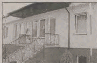
Budynek urzędu po remoncie