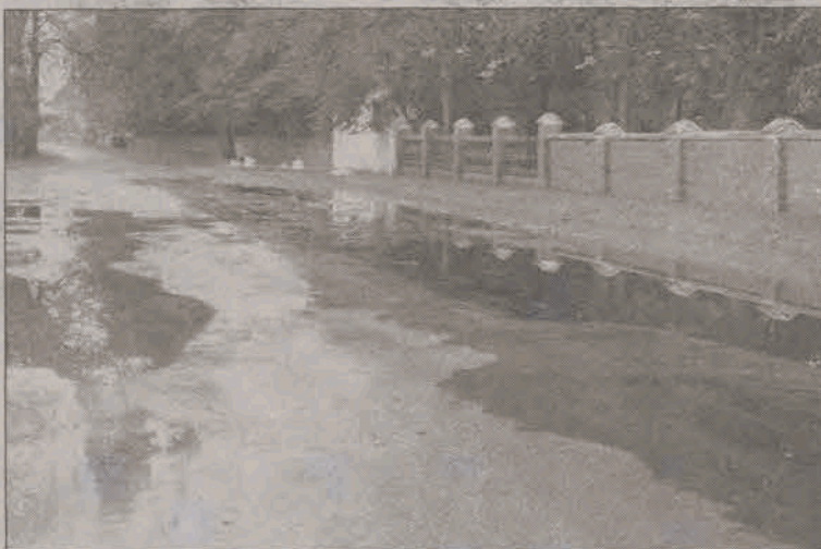
Dziury w drodze przy parku w Kiemozi po deszczu wypełniły się wodą. Mimo to widać, jak kiepski jest stan nawierzchni.