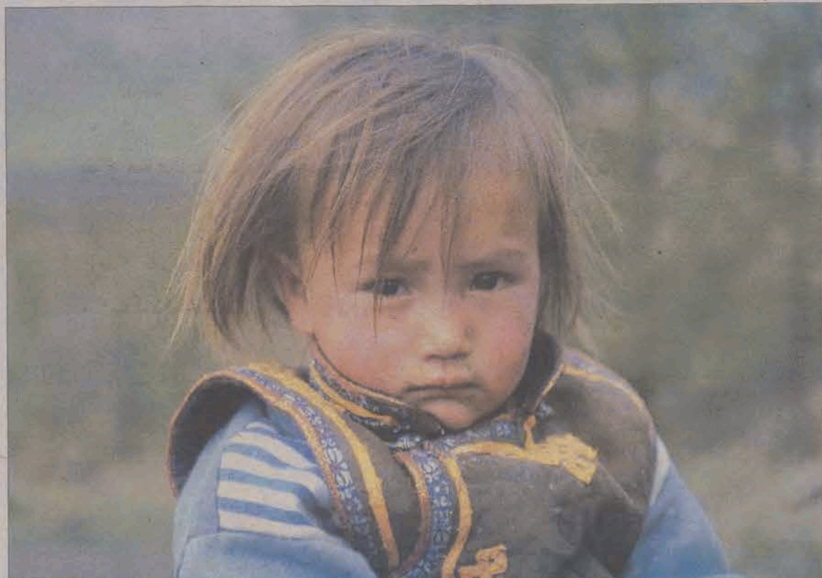
Dzieciństwo na stepie też może być urocze. Mongolskie dziecko w obiektywie aparatu podróżników.