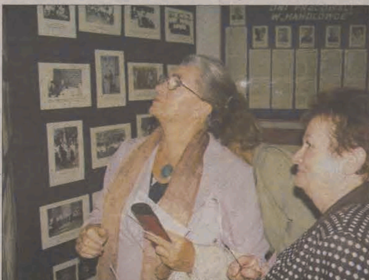
Wystawa historycznych fotografii cieszyła się dużym powodzeniem. Na zdjęciu panie, które ukończyły szkołę w 1958 roku.