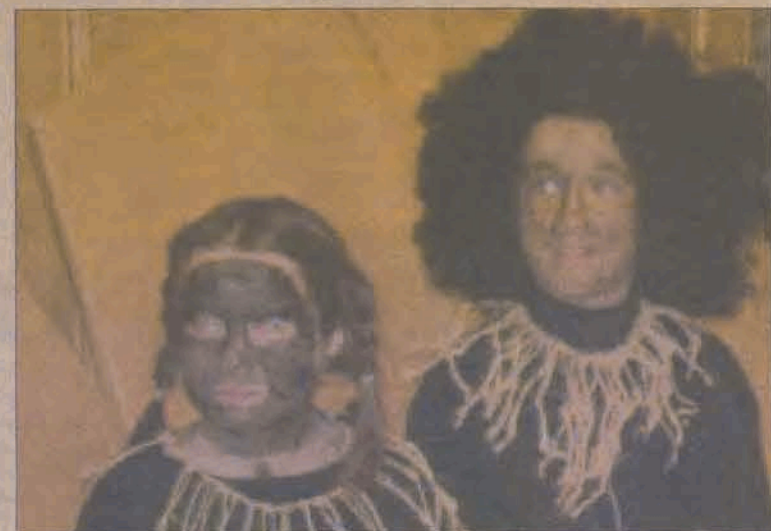
Tak w jednej z części ubiegłorocznej edycji konkursu prezentowali się uczniowie SP 1 ze Strykowa

W tym roku organizatorzy chcą zwrócić szczególną uwagę na problem głodu i niedożywienia dzieci w krajach Trzeciego Świata. W pięciu dotychczasowych edycjach konkursu wzięło udział ponad 6 tysięcy uczniów szkół podstawowych i gimnazjów. Najlepszych nagrodzono licznymi upominkami rzeczowymi oraz wypoczynkiem nad morzem. Ale nie nagrody w tym konkursie są najważniejsze, ale możliwość nawiązania kontaktu z rówieśnikami potrzebującymi gdzieś daleko pomocy.