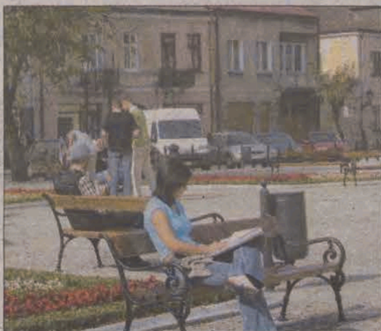
Zarówno mieszkańcy, jak i radni z jednej strony cieszą się odnowionym Nowym Rynkiem, z drugiej jednak strony - mają dużo krytycznych opinii.

Radni dyskutowali też nad tym, czy zieleni na Rynku jest wystarczająco dużo, czy