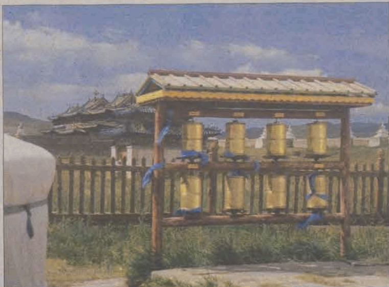
Młynki modlitewne w klasztorze Erdene Dzuu.

Mongolia to pustynia Gobi na południu, ale przede wszystkim step i sporo gór. Mongołowie stanowią 85% ludności, są buddystami, w zachodnich rejonach kraju dominują Kazachowie - wyznawcy islamu. Na wschodzie kraju wyprawa często spotykała pozostałość szamańskich tradycji - kopce usypane z kamieni i przyozdobione kolorowymi wstążkami - owo. Niezależ-