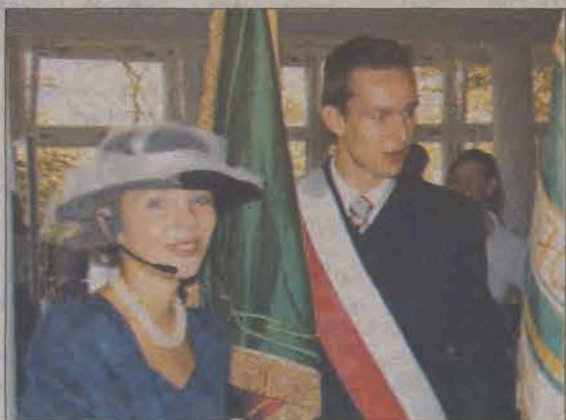
Uczniowie Ekonomika wystąpili przed absolwentami w przedstawieniu teatralnym „Ta nasza młodość”.