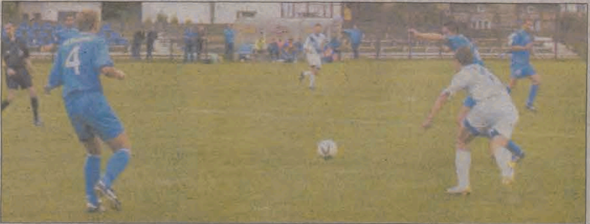
Mimo, że głownianie zaprezentowali się lepiej niż przed tygodniem, przegrali w Paradyżu 0:1.