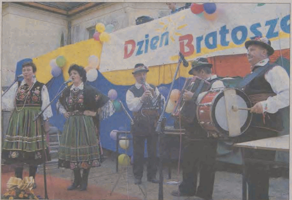
Zespół ludowy Bracewioki dał popis lokalnego folkloru.

Tegoroczna była drugą z rzędu, a organizatorzy zapowiadają, że w przyszłym roku można liczyć na trzecią. - Takich imprez brakuje właśnie w naszym rejonie. Zazwyczaj, jeśli już coś się dzieje to albo w Stryk-