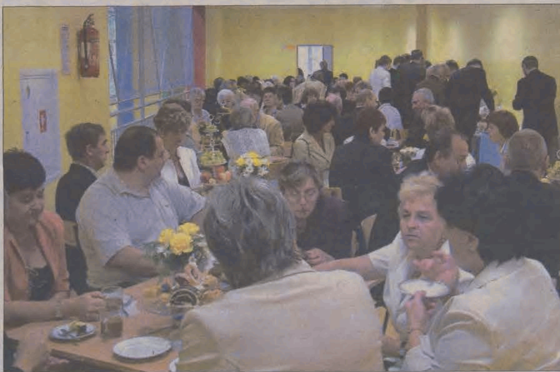
Wśród jubileuszowych gości przeważali obecni i byli pracownicy głowieńskiej oświaty. W kawiarence dzielili się pierwszymi wrażeniami na temat nowej hali sportowej.