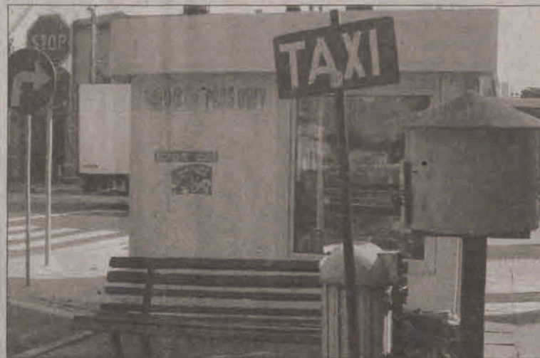
Na ten postój w centrum Strykowa od przyszłego roku podjeżdżać będzie 6 taksówek