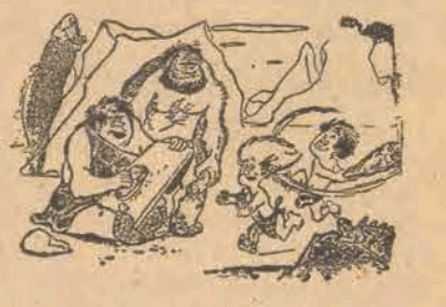
— Nie wiem, czy z naszego syna coś wyrośnie? Już trzeci raz zamachnął się i nie trafił.

reperacji przedstawia świadectwo pracy, względnie legitymację Związków Zawodowych. Według nowych cen podziałowanie wraz z obcasami jednej pary obuwia męskiego kosztować będzie 560 zł., damskiego i dzieciennego 460 zł. Żelówki męskie 380 zł., damskie i dzieciennego 320 zł., obcasy męskie 180 zł., damskie i dzieciennego 140 zł.