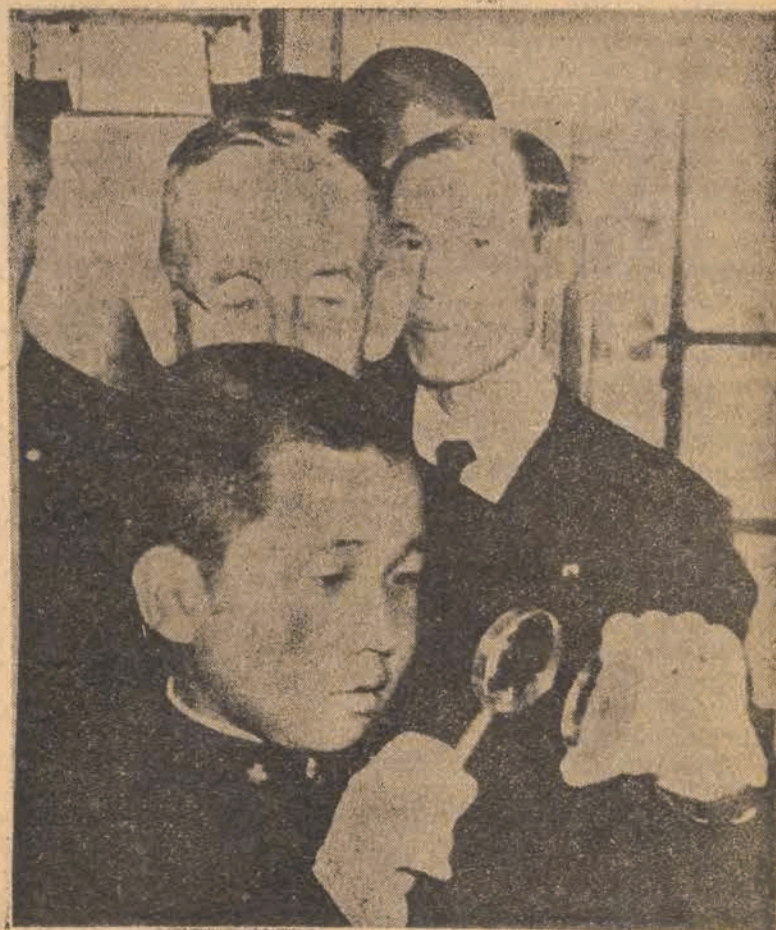
Cesarzowi japońskiemu i jego rodzinie nie powodzi się zbyt źle. Zdjęcie nasze przedstawia syna cesarza Hirohito, którego troskliwie Amerykanie otaczają specjalną opieką, wychowując go pod opieką specjalnych pedagogów.