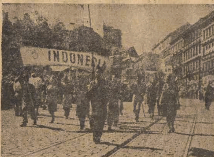
Delegacja młodzieży indonezyjskiej w czasie pochodu na świątecznym Festiwalu Młodzieży w Pradze Czeskiej.