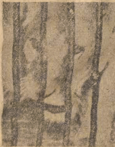
Nie budził zbyt wielkiego zaufania „mina” twicy z paryskiego Zoo.

z poparciem projektu jugosłowiańskiej rezolucji, żądającej aby Zgromadzenie wezwało wszystkich swych członków do realizacji postanowień i uchwał ONZ w sprawie wydania przestępców wojennych, quislingów i zdrajców krajów, w których popełnili oni zbrodnie.