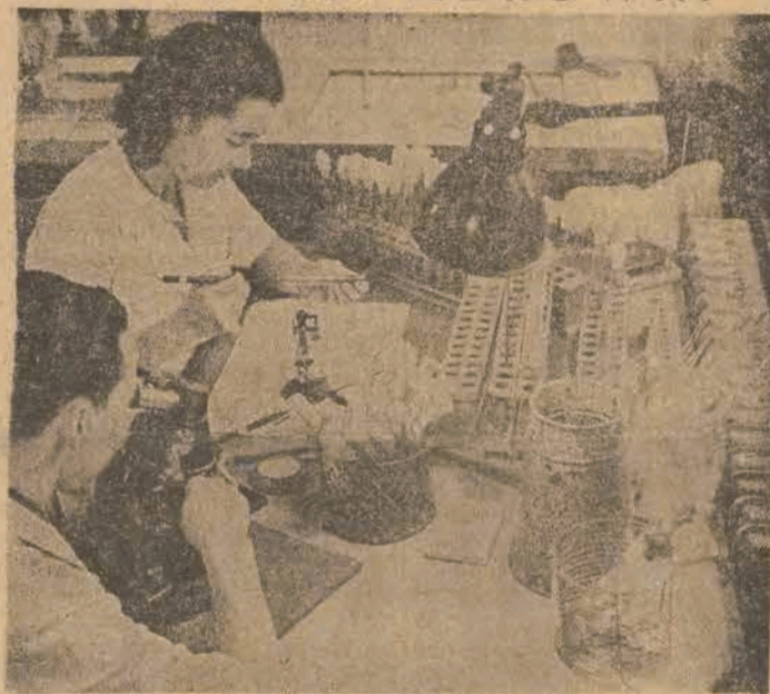
W paryskim Instytucie Pasteurowskim im. powstaje oręż do walki z chorobą — nowe szczepionki.