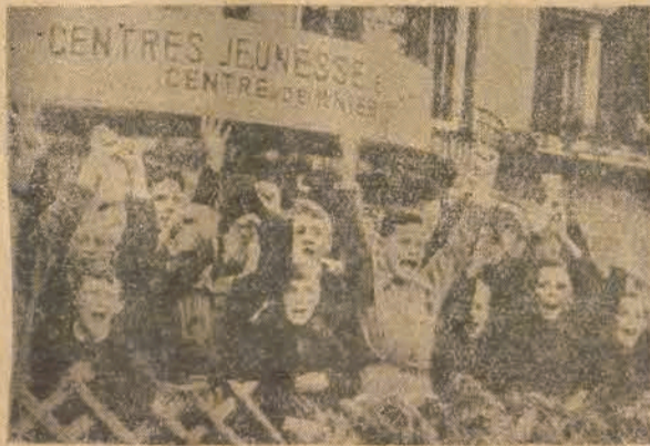
Francuzi prowadzą w swojej strefie okupacyjnej reedukację młodzieży niemieckiej. Na zdjęciu wychowankowie specjalnego ośrodka w Kniebis.