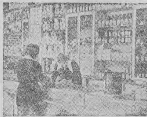
Sklep Nr 192 przy zbiegu ulic Piotrkowskiej i Więckowskiej

— Obrót dzienny dochodzi do pół miliona zł, za tę sumę kupuje u nas przeciętnie około 600 klientów. W najbliższych dniach dla wygody kupujących wprowadzimy dział nowy — wędlin, a następnie dział mięsa — już przyrządzonego do gotowania, czy smażenia