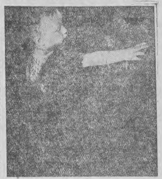
Mały Grzesio po raz pierwszy widzi jagody

POKAZ PRAC ABSOLWENTÓW WYDZIAŁU AKTORSKIEGO P. W. S. T. Dziś o godz. 15-ej w Państwowym Teatrze W. P. odbędzie się pokaz prac absolwentów Wydziału Aktorskiego Państwowej Wyższej Szkoły Teatralnej. W programie: Kochanowski, Fredro, Musset, Shaw, Kiltner, Szański, Nałkowska. Bilety w kasie teatru. Dalszy ciąg pokazu jutro, w niedzielę, o godz. 11-ej.