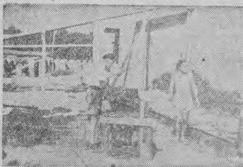
W ciepłe słoneczne promieni rażno i lekko się pracuje