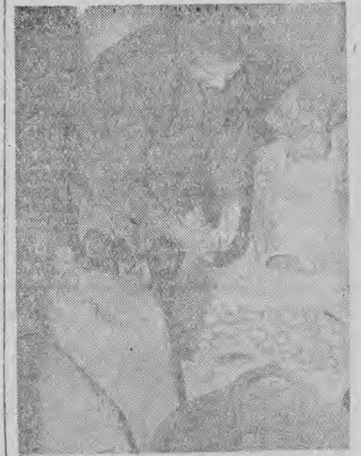
Cukier — i nie tylko cukier znaleziono w mieszkaniu kupcowej St. Kusideł (ul. Armii Czerwonej 9)