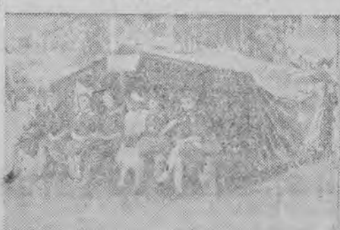
Młoda ekipa w pogotowiu niesienia doraźnej pomocy