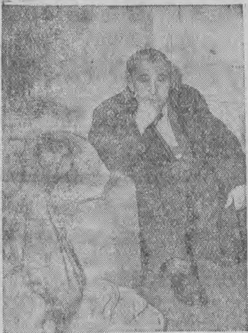
Gorkich Iz rzeźnika p. Bębenista (ul. Kilińskiego 223) już nie osłodzi ten worek cukru, skonfiskowany przez Komisję Specjalną.