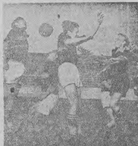
Nasza młodzież piłkarska dotychczas rozgrywała mecze przy pustych trybunach. Dzisiaj przyglądać jej się będzie cała Łódź sportowa.

Takie pytanie niewątpliwie zada sobie niejedyn z miłośników piłkarstwa, który wybierze się dzisiaj na stadion ŁKS-u. Śmiało możemy tych wszystkich zapewnić, że nie zawiodą się. Dzisiejsza gra może być nawet lepszą od jutrzejszej gry na stadionie W. P. w Warszawie, gdzie spotkają się oficjalnie nasze reprezentacje państwowe, gdyż prawie wszyscy młodzi piłkarze węgierscy, chociaż