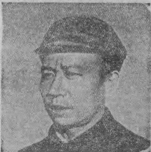
Gen. Lin - Czaow - Chi głównodowodzący chińskich wojsk ludowych pod Kaiganem.

Ostatnie rezerwy faszystów znalazły się w kotle pod Subsien