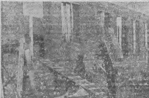
Przy ul. Sienkiewicza w przyspieszonym tempie prowadzone są roboty budowy gmachu na złobek PZPDz.