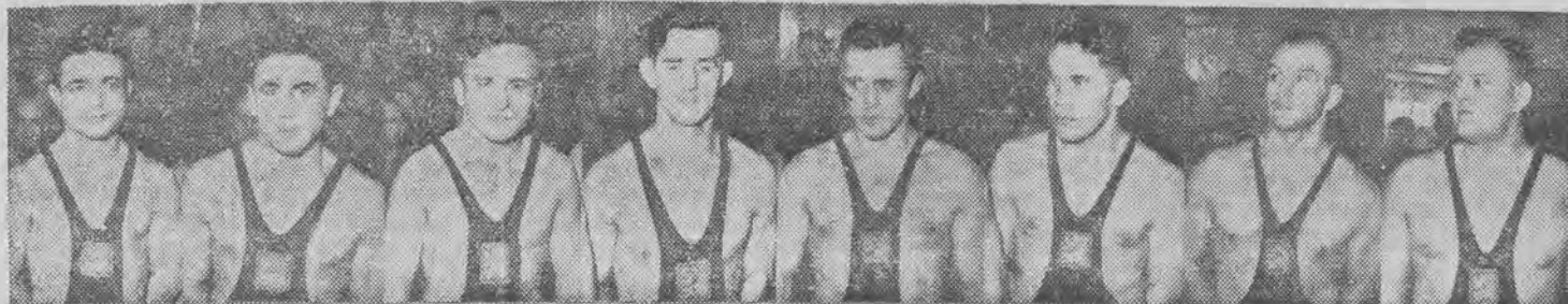
Zasłużona reprezentacja CSR która w wysokim stosunku 6:2 pokonała w Pradze naszą reprezentację.