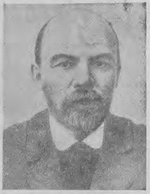
W. I. Lenin w Zakopanem

W. Lenin Przemówienie w związku z zabójstwem Róży Luksemburg i Karola Liebknechta 19 stycznia 1919 roku (Krótkie sprawozdanie prasowe) Dzisiaj w Berlinie burżuazja i socjal-zdracy triumfują — udało im się zamordować Karola Liebknechta i Różę Luksemburg. Ebert i Scheidemann, którzy przez 4 lata pędzili robotników na rzeź dla interesów grabieżczych, dzisiaj wzięli na siebie rolę katów wódzów proletariackich. Na przykładzie rewolucji niemieckiej przekonujemy się, że „demokracja” jest tylko przykryciem dla burżazyjnego rabunku i najdzikszego gwałtu. Śmierć katom! (Prawda Nr 14, 21 stycznia 1919 r.)