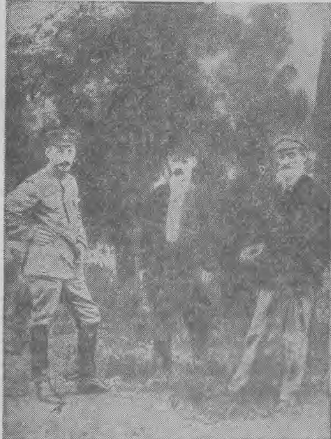
Feliks Dzierżyński, Julian Marchlewski, Feliks Kon (1920 r.)

Tak być dłużej nie może. Temu ohyd-nemu porządkowi koniec nadchodzi! Nie powinno być nierówności w posiadaniu ziemi. Świat musi należeć do tych, którzy pracują. Wtedy nastąpi ład nowy — ład socjalistyczny. Ale taki porządek sam nie przyjdzie. Trzeba go zdobyć walką, trzeba go wywalczyć przez rewolucję... Do szeregów więc wszyscy! Pod sztandar socjaldemokracji! Do walki o wolność, o sprawiedliwość i socjalizm. „Gromada” Nr 1, W-wa sierpień 1918