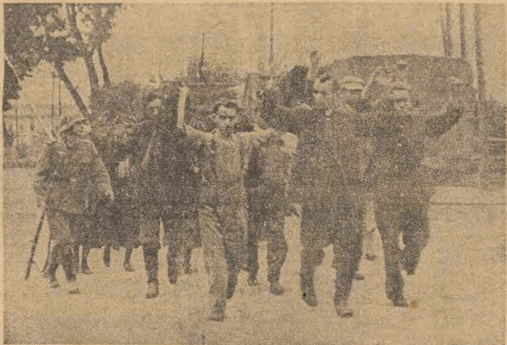
Tak się zaczęło panowanie Alberta Forstera w Gdańsku. — Pędzenie Polaków na rzeź.

wego bezpieczeństwa, a także jego zbliżenie ideologiczne do zasad faszystowskiego wytworzyły podłoże, na którym ówczesny minister spraw zagranicznych Józef Beck mógł oprzeć zasadę załatwiania wszelkich sporów polsko-gdańskich z pominięciem Ligi Narodów. Zasada ta była zgodna z linią polityki NSDAP dążącej do skłócenia obozu państw demokratycznych i Fors-