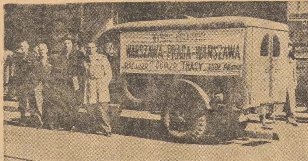
Wóz Komisji Technicznej wyścigu kolarskiego Warszawa — Praga przed redakcją „Głosu Robotniczego”.

Jakżeśmy już donosili, w tych dniach bawiła w Łodzi Komisja Techniczna objeżdżająca trasę wyścigów Warszawa — Praga i Praga — Warszawa organizowanych przez redakcję pism „Głos Ludu” i „Rude Pravo”.