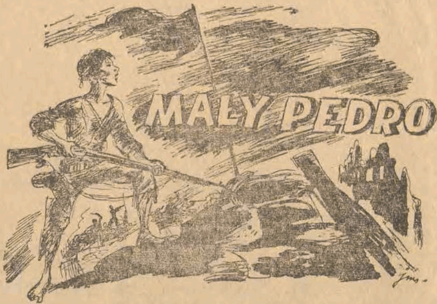
(W rocznicę ogłoszenia republiki w Hiszpanii)

Ojciec Pedra był dyktando I tak mówił, gdy wyruszał w bój: „Kraj obronię dynamitem twardym, Gdy nie ja — to syn obroni mój!”