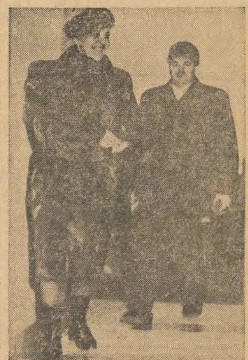
Minister spraw wewnętrznych Finlandii Leino — wraz z małżonką Herttą Leino — witani byli owacyjnie w stolicy Finlandii po powrocie z Moskwy, gdzie brali udział w rokovaniach radziecko-fińskich zakończonych podpisaniem traktatu o przyjaźni i wzajemnej pomocy.

W budynku, w którym przebywają korespondenci prasy zagranicznych, akredytowani przy konferencji panamerykańskiej, słychać było wyraźnie strzały karabinów maszyno-