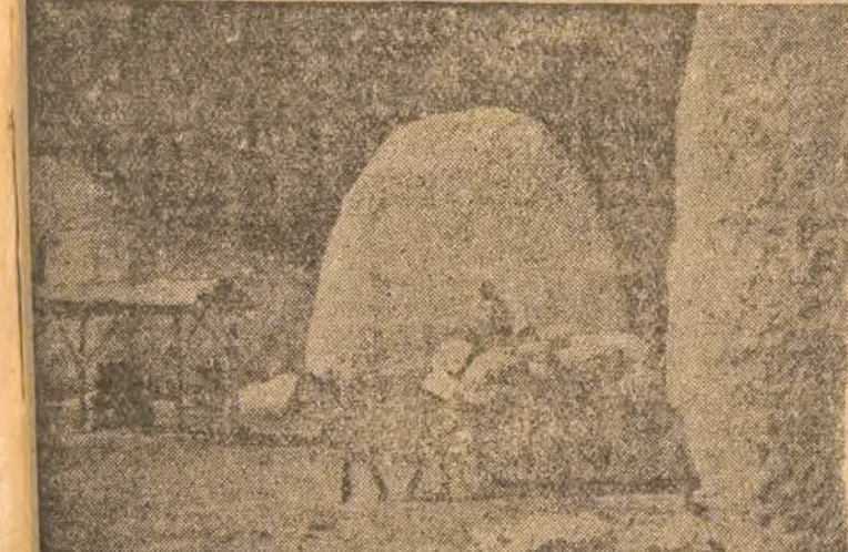
Bawełna przygotowana dla fabryk włókienniczych