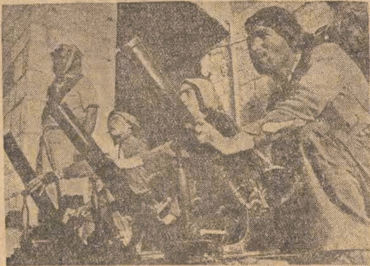
Napastnicy arabscy — przy obsłudze najnowszych moździerzy brytyjskich.