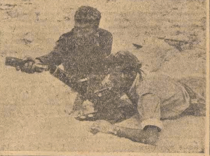
Żołnierze armii żydowskiej przy obsłudze rannego — pod Lydda.