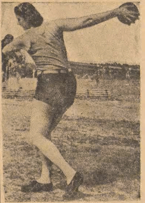
Gruzinka Dumbadze, rekordzistka świata w rzucie dyskiem.

cie 8 km przyniósł zwycięstwo Zielienowowi w czasie 26:27,6 min. Mistrzostwo w konkurencji kobiecej zdobyła Muszkiina, która przebiegła 2 km w 7:24,2 min.