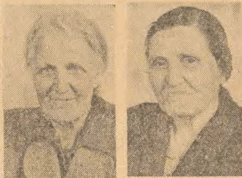
low. Krzynówek wrzeczniarka 6-ty raz dostaje pierwszą nagrodę