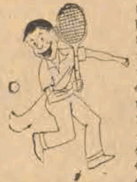
W tym roku

LONDYN (obsł. wł.) Wczoraj rozpoczął się na kortach trawiastych w Wimbledonie doroczny turniej tenisowy w konkurencji międzynarodowej.