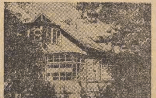
Kolonie Wimy na Wiśniowej Górze

Jesteśmy na kolonii dzieci robotników „Wimy”. To już ostatni etap naszej „kolonijnej” wędrówki po Wiśniowej Górze. Dzieci wybiegały właśnie w jadalnię do ogrodu po podwieczorku. Na stołach zostały jeszcze kromki chleba z jajecznicą i kubki z niedopitą kawą z mlekiem. Dzieciaki wyglądały zdrowo, chociaż buzie umorusane, a ubranka poplamione. — Nie można nastarczyć ze zmianą ubrania — mówi wychowawczyni — tak zawsze ubrudzą się w piachu. — Dopiero w naszej obecności, kiedy zwróciliśmy na to uwagę, dzieci pobiegły do znajdującej się na dziedziń-