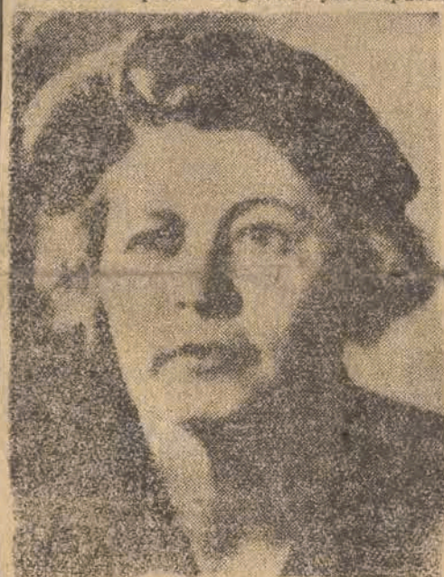
Min. Anna Pauker

Węgierskiej Molnara, ministra spraw zagranicznych Federacyjnej Republiki Jugosławii Simica, ministra spraw zagranicznych Republiki Czechosłowackiej Clementisa, ministra spraw zagranicznych Ludowej Republiki Ru-