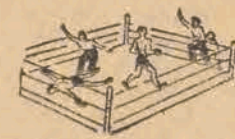
W tym roku

W związku z Tygodniem Polskiego Czerwonego Krzyża, odbyły się w dniu wczorajszym pieściarskie zawody towarzyskie pomiędzy zespołami: Teczy i Concordii z Piotrkowa.