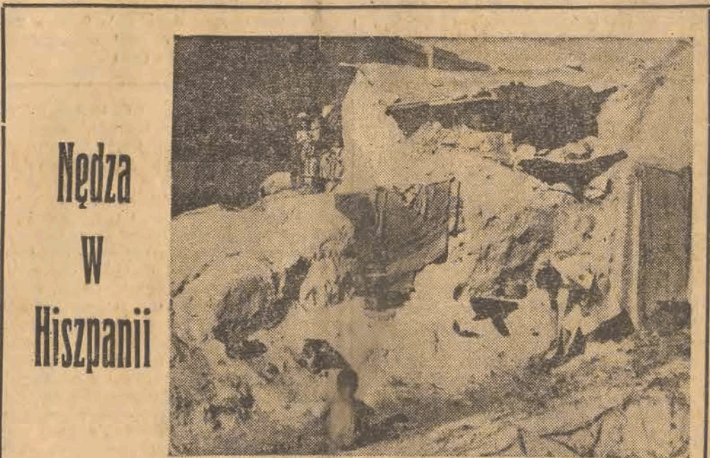
Nędza w Hiszpanii

Decyzje konferencji londyńskiej nie mają ani mocy prawnej, ani też jakiegokolwiek autorytetu moralnego. Oto wyrok wszystkich narodów, zainteresowanych w utrzymaniu pokoju i bezpieczeństwa Europy, których zdanie znalazło pełny i dobitny wyraz w oświadczeniu Konferencji Warszawskiej. Pięć punktów, sformułowanych w oświadczeniu warszawskim — stwierdzają „Izwiestia” — porusza kwestie, wymagające niezwłocznego rozstrzygnięcia. Jest to program wszystkich narodów europejskich w sprawie Niemiec, oparty na zasadach Jalty i Poczdamu. Urzeczywistnienie tego programu stanowi jedyną możliwą gwarancję rozstrzygnięcia problemu niemieckiego w interesie wszystkich narodów, które nie chcą odrodzenia agresywnego militarystyki niemieckiej, popieranego przez monopole amerykańskie i angielskie.