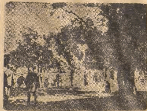
PARYŻ 1900 R.

Długa z kolei Olimpiada nowożytna odbyła się w 1900 r. w Paryżu.