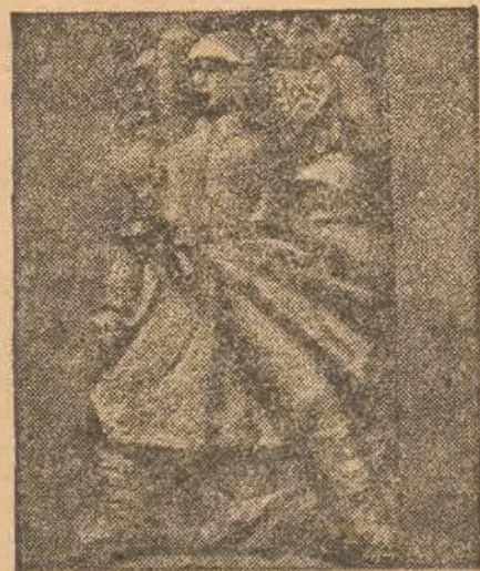
JEDNA Z RZEZB WYSTAWY, WYOBRAZAJĄCA POLSKO-RADZIECKIE BRATERSTWO BRONI. RZEZBA TA JEST DZIEŁEM MŁODEGO ARTYSTY BAN-DURY.