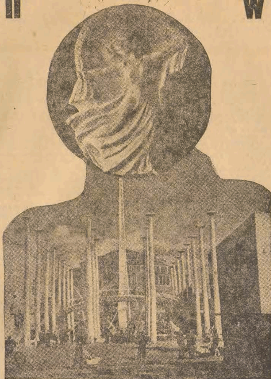
„Dnia 21 b. m., w przeddzień 4 rocznicy lipcowego Manifestu PKWN, Prezydent R. P., Bolesław Bierut, dokonał otwarcia Wystawy Ziem Odzyskanych we Wrocławiu. Wystawa ta — jak oświadczył w swej wypowiedzi o WZO ob. Prezydent — jest generalnym przeglądem dorobku pracy polskiej na Ziemiach Odzyskanych za ubiegłe trzy lata, przeglądem, który wzmacnia ufność w nasze siły i naszą przyszłość i potrafi porwać nawet tych, którzy skłonni są do zwątpień.