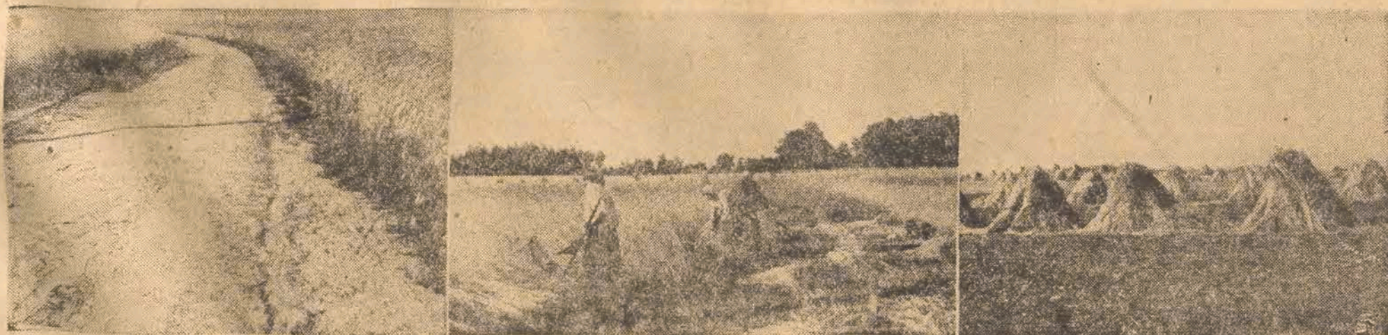
Zamiast łanów bujnie rozkwitłego żyta — napotykalmy już rżyska, pokryte kopcami żytnich snopów. Nie długo i kopce znikną, gdyż żęte żyto przeschnawszy na powietrzu zostanie zwiezione do stodoł. Brząk kos i sierpów nie prędko jednak zamilknie na polach, gdyż oto przychodzi kolej na pszenicę, jęczmień i owies, które okres deszczów przetrwały nad podziw dobrze. Zbiory tych zbóż także zapowiadają się jak najlepiej, kłosy są pełne, słoma urodziwa, no, a pogoda w ostatnich dniach pierwszorzędnie dopisuje.