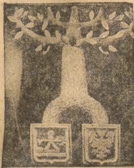
NA TŁE WĘGLOWEJ ŚCIANY — DRZEWO, RODZĄCE ZŁOTE JABŁKA. „ROSNIE” ONO W SALI JEDNOSTKI SŁĄSKA, NA WYSTAWIE ZIEM ODZYSKANYCH WE WROCŁAWIU.