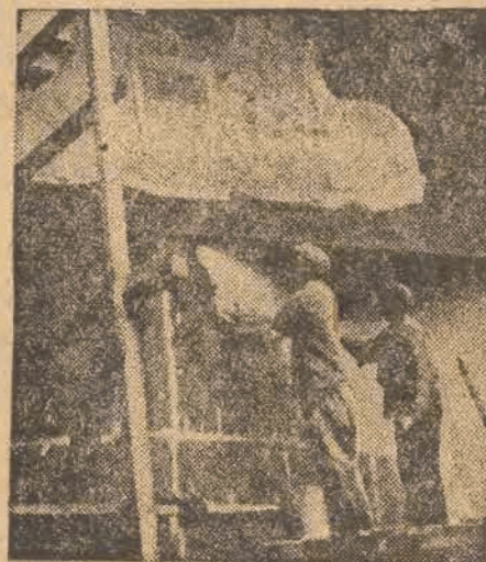
A OTO — WNETRZE SALI DOCHODU SPOŁECZNEGO. NAD ROBOTNIKAMI „ZAPINAJĄCYMI” SAŁE „NA OSTATNI GUZIK” PLASTYKA „HUTNICTWO”.