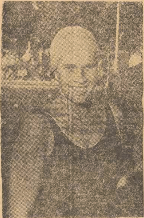
Janasówna (Orkan Krotoszyn) nowa mistrzyni Polski na 200 m. st. klasycznym.

Na nowo otwartym basenie pływackim stadionu Olimpijskiego we Wrocławiu zakończone zostały trzydniowe mistrzostwa pływackie Polski w konkurencji pań i panów. W ostatnim dniu zawodów doskonali zawodniczka