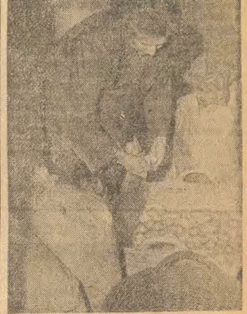
Cukier — i nie tylko cukier znaleziono w mieszkaniu kupcowej St. Kusideł (ul. Armii Czerwonej 9)