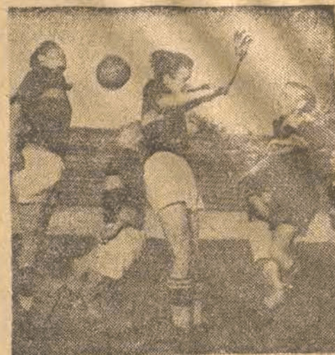
Nasza młodzież piłkarska dotychczas rozgrywała mecze przy pustych trybunach. Dzisiaj przyglądać jej się będzie cała Łódź sportowa.

Takie pytanie niewątpliwie zada sobie nie jeden z miłośników piłkarstwa, który wybierze się dzisiaj na stadion ŁKS-u. Śmiało możemy tych wszystkich zapewnić, że nie zawiodą się. Dzisiejsza gra może być nawet lepszą od jutrzejszej gry na stadionie W. P. w Warszawie, gdzie spotkają się oficjalnie nasze reprezentacje państwowe, gdyż prawie wszyscy młodzi piłkarze węgierscy, chociaż