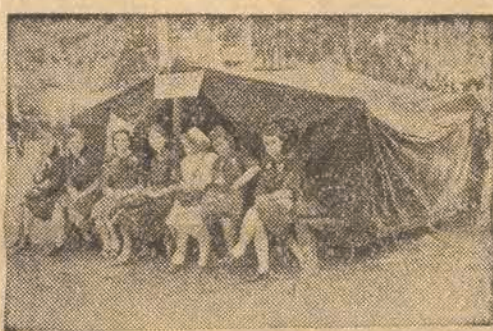
Młoda ekipa w pogotowiu niesienia doraźnej pomocy