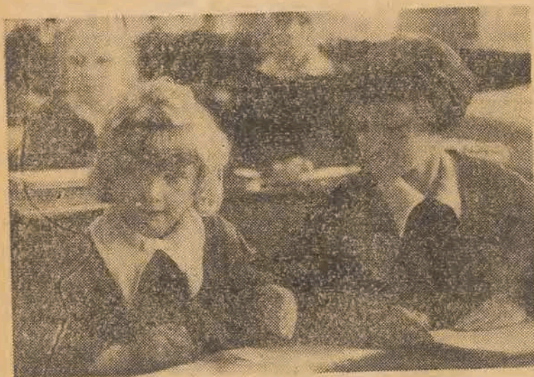
Siedmioletnie dziewczęta nie mogą się doczekać końca lekcji. Już jutro pojedą własną koleją w daleki świat przygód, gdzie czeka na nie słońce, powietrze i woda