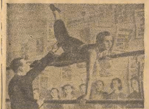
Młodzież szkolna w ZSRR z zamiłowaniem uprawia gimnastykę przyrządową.

Dużą rolę w rozwoju tężyzny fizycznej chłopców i dziewcząt odgrywa turystyka. W roku bieżącym ponad 4 miliony młodzieży radzieckiej spędziło lato na świeżym powie- trzu, w obozach wędrownych i na szlakach turystycznych ZSRR.