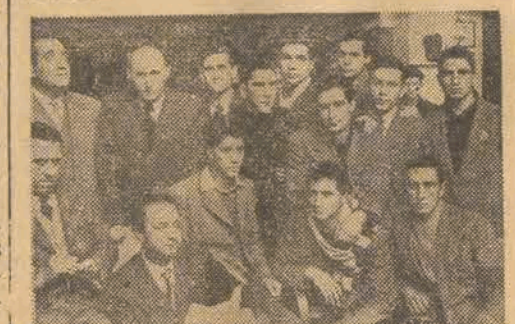
„Piszczyarze muscy” po występie w Gdań- sku. Zmierzą się dzisiaj z reprezentacją Szczeci- na a w niedzielę z reprezentacją Wybrzeża!