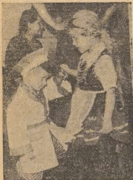
drzymym pałacu Ejtingona przy ul. Wigury 12. Kilka widnych, jasnych i dużych pokoi zostało przygotowanych, aby pomieścić 40-ro

Dnia 20 bm. odbyło się uroczyste otwarcie przedszkola, przeznaczonego dla dzieci robotników PZPDz. Nr. 3. Przedszkole mieści się w