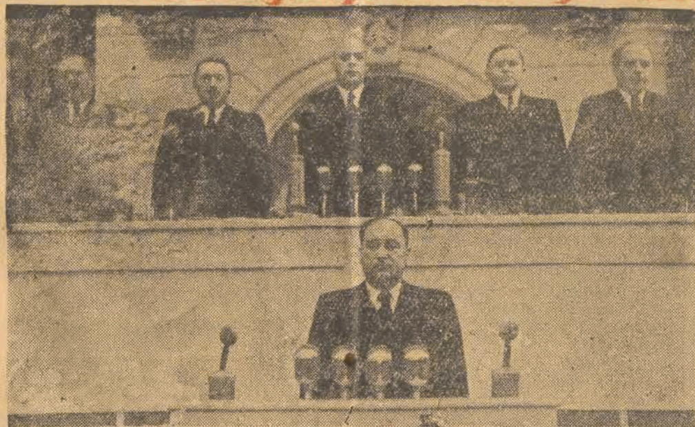
Tow. Ponomarenko wita I-szy Kongres Polskiej Zjednoczonej Partii Robotniczej w imieniu Partii Komunistycznej ZSRR.