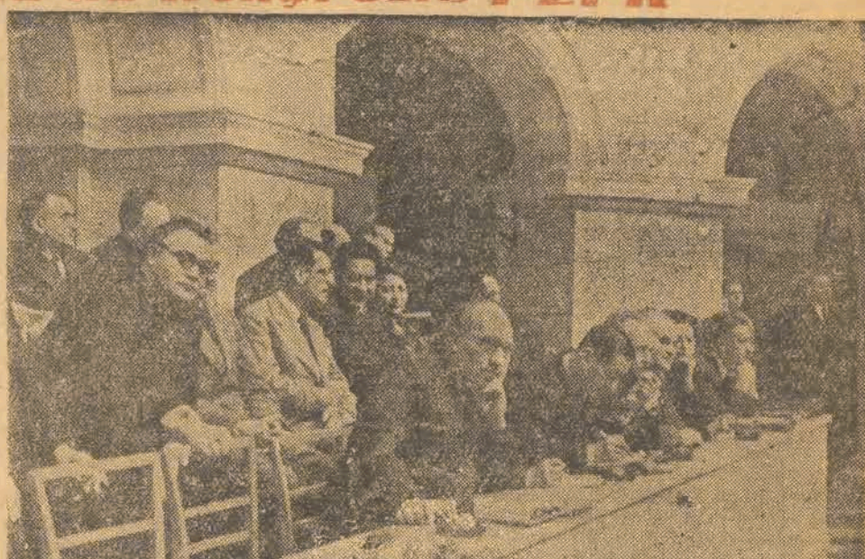
Delegaci partii komunistycznych i robotniczych z całego świata biorą udział w Kongresie w charakterze gości.