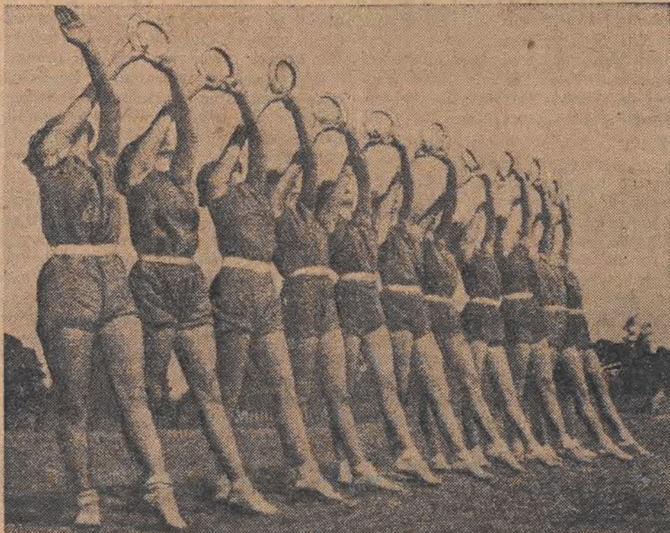
Czechostawia obok ZSRR jest krajem, w którym na wychowanie fizyczne obywateli kładzie się szczególny nacisk. Sport — sportem, a wychowanie fizyczne — wychowaniem fizycznym. Oto przykład: sportsmenki praskiej „Sparty” obok treningów sportowych, z samodzielnymi ćwiczeniami gimnastycznymi, które podnoszą i utrzymują ich sprawność fizyczną, młodość i... urodę