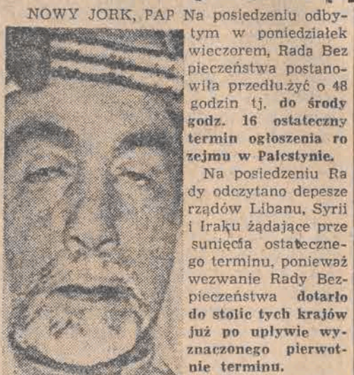
Emir Transjordanii Abdullah

został przesunięty przez Radę Bezpieczeństwa o 48 godzin