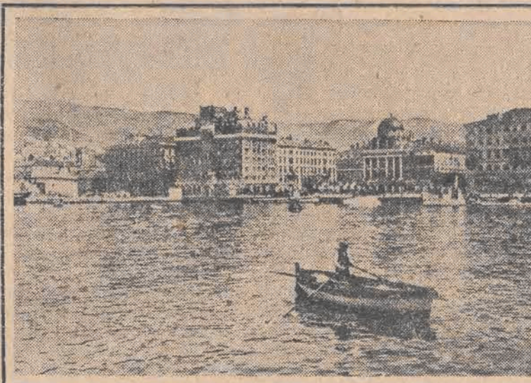
BELGRAD (PAP). Z Triestu donoszą, że doszło tam do masowych zaburzeń i demonstracji z powodu rekwizycji związku byłych partyzantów Triestu przez anglo-amerykański rząd wojskowy. Silne oddziały policji usiłowały interweniować, ale nie zdołały rozprzążyć manifestantów.

BUDAPESZT, PAP. — Przewodniczącym Węgierskiej Partii Pracujących został Szakasits, sekretarzem generalnym Rakosi, zastępcami sekretarza generalnego Farkas, Kadar i Márosan. Poza tym wybrano członków komisji politycznej i organizacyjnej. Naczelnym redaktorem centralnego organu partii „Szabad Nep” został wybrany ednomyslnie Reval.