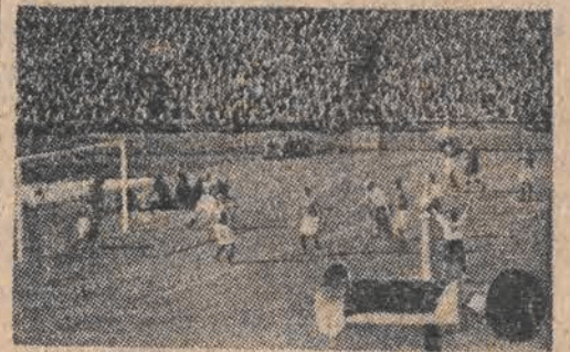
W Londynie rozpoczął się już olimpijski turniej piłki nożnej. Oto fragment jednego z meczów D-030208