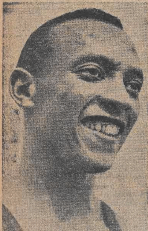
Owens (USA) — bohater olimpiady berlińskiej uśmiecha się beztrudno. Do tej pory rekordy jego nie zostały pobite w Londynie.

Widzew remisuje z Polonią 1:1, a ŁKS gromi AKS 5:2