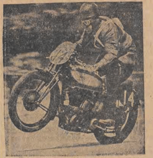
interlokutor — że Czesi jechali na tych samych maszynach co my (drużyny narodowe — przyp. Red.), to jest na czeskich „C. Z.”. Maszyny te najlepiej wytrzymały raid. Naszej drużynie narodowej towarzyszył przez cały czas mechanik czeski, który opiekował się maszynami przez całą drogę.