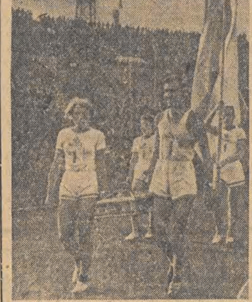
Fragment defilady ze „Spartakiady” w Moskwie

„SPARTAK” PROWADZI W MISTRZOSTWACH PIŁKARSKICH W spotkaniach piłkarskich o mistrzostwo Związku Radzieckiego uzyskano następujące wyniki: moskiewskie „Dynamo” przegrało niespodziewanie z „Torpedo” w stosunku 1:2, w Kujbyszewie „Spartak” (Moskwa) pokonał miejscową drużynę „Skrzydła Sowieców” w stosunku 1:0. Drużyna moskiewskich kolejarzy „Lokomotiv” pokonała niespodziewanie „Dynamo” (Tyflis) w stosunku 1:0. Na czele tabeli rozgrywek wysunęła się drużyna „Spartak” (Moskwa), mając w 18 grach 27 punktów.