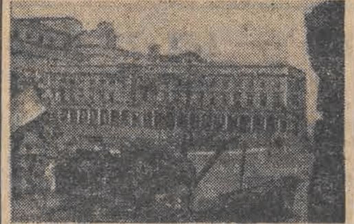
Gmach Teatru Narodowego odbudowuje wojsko. — Do grudnia będzie on gotowy w stanie surowym.

Atrakcje — wzmożona praca — przedkongresowe zobowiązania — przygotowania do wielkiego wydarzenia grudniowego (Od własnego korespondenta „Głosu“)