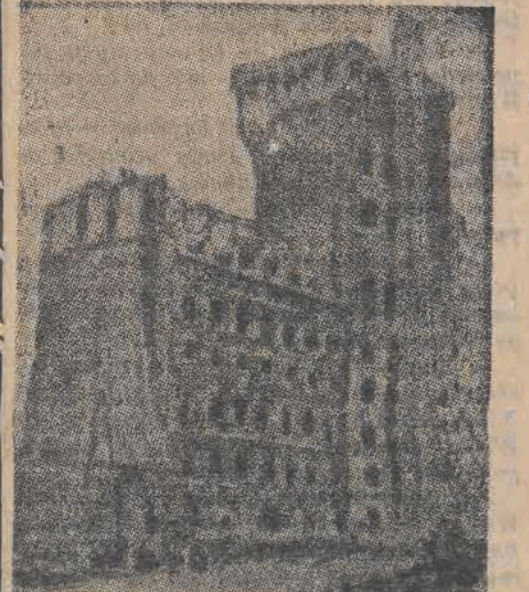
58-metrowej wysokości gmach Centrali Telefonów znajduje się w stadium odbudowy.

W dniu 30-tego rocznicy istnienia Węgierskiej Partii Komunistycznej nastąpi w Budapeszcie otwarcie Instytutu Badania Ruchu Robotniczego, w którym zostaną ześrodkowane prace badawcze nad zagadnieniami węgierskiego i między narodowego ruchu robotniczego.