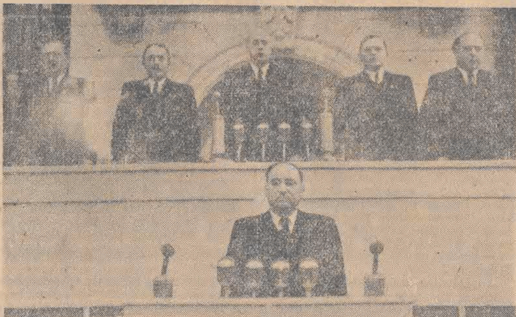
Tow. Ponomarenko wita 1-szy Kongres Polskiej Zjednoczonej Partii Robotniczej w imieniu Partii Komunistycznej ZSRR.