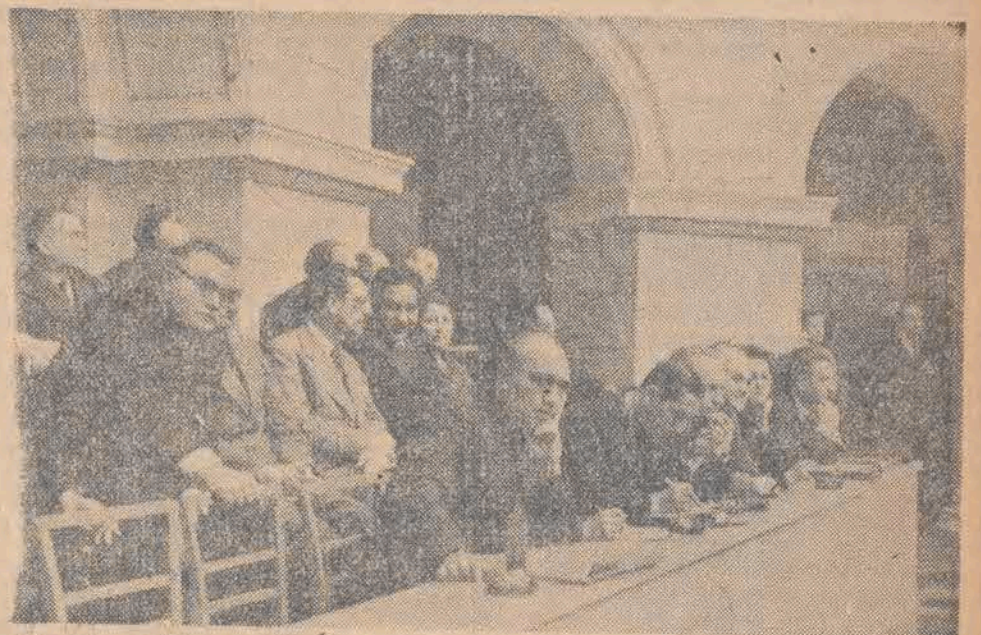
Delegaci partii komunistycznych i robotniczych z całego świata biorą udział w Kongresie w charakterze gości.