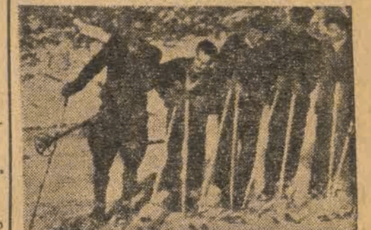
W Zakopanem odbył się sztafetowy bieg narciarski 4 razy 10 km o mistrzostwo Polski. Zwyciężyła drużyna „Wisły” (Zakopane) w czasie 3:13,20

Mistrzowi Polski w kolarstwie, Jerzemu Bekowi, Łódzkiemu Okręgowemu Związkowi Kolarstwu, Dzielnickiemu Klubowi Sportowemu i ŁKS-owi za nadesłane życzenia noworoczne — serdecznie dziękujemy.