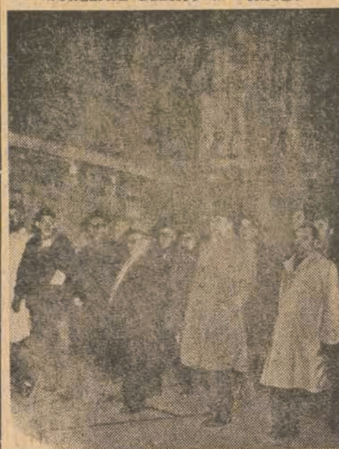
Francuscy posłowie komunistyczni z tow. JACQUES DUCLOS na czele, opuszczają późną nocą gmach francuskiego Zgromadzenia Narodowego po burzliwej debacie w sprawie wyboru wiceprzewodniczących Zgromadzenia.

NOWY JORK PAP. — Oświadczenie prezydenta Trumana, zapowiadające wystąpienie wkrótce w kongresie z wnioskiem o udzielenie dalszej pomocy Chinom, wywołało ożywione komentarze w prasie i opinii publicznej Stanów Zjednoczonych. Grupa znanych działaczy postępowych postanowiła zwołać konferencję, która będzie specjalnie poświęcona polityce Stanów Zjednoczonych wobec Chin i Dalekiego Wschodu.