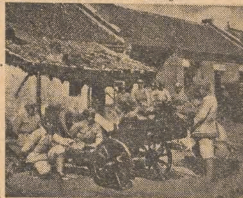
WALKI ARTYLERYJSKIE W YING-PAN

Jeden z wybitnych znawców problemów Azji wschodniej prof. Lattimore wystąpił przeciwko okazywaniu pomocy rządowi Czang-Kai-Szeka. Czang-Kai-Szek nie zdoła opanować obecnej sytuacji w Chinach, gdyż nie cieszy się poparciem narodu chińskiego.