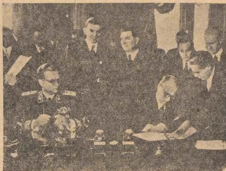
Zdjęcia z uroczystych aktów podpisania sojuszu jugosłowiańsko - węgierskiego i jugosłowiańsko - bułgarskiego. Zdjęcie I-sze — Marszałek Tito i premier Dymitrow podpisują akt sojuszu w Warni. Zdjęcie II-gie: marsz. Tito i premier Dinnyes podpisują akt sojuszu w Budapeszcie.