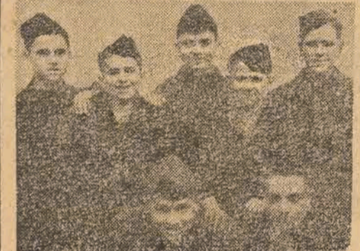
Chłopcy z Jugosławii