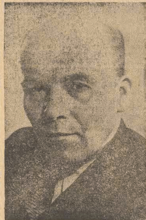
NIANIA PRZYJAŹNI Z NARODAMI ZW. RADZIECKIM JEST NAJLEPSZYM SPRAWDZIANEM EWOLUCJI IDEOLOGICZNEJ, JAKĄ ZACHODZI TAK W PPS JAK I W INNYCH PARTIACH BLOKU DEMOKRATYCZNEGO.

5 ROZWIJAJĄCY SIĘ WSPANIALE W NARODZIE POLSKIM PROCES ZACIES-