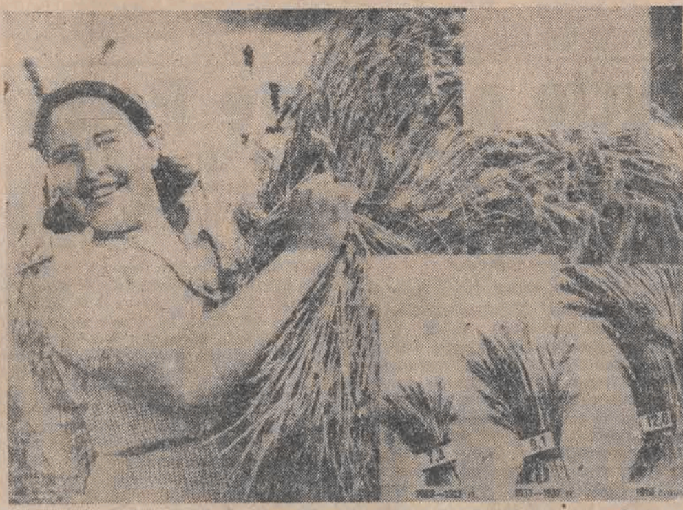
Wzrost urodzaju z 1 ha w Związku Radzieckim

Pewien korespondent zagraniczny, który znał wieś carską przynajmniej, że nie poznał wsi radzieckiej, gdzie widzi się szkoły, czytelnie i maszyny. Rosja miała w 1910 roku 2.200.000 drewnianych pługów. Przeważna część chłopów rosyjskich nie słyszała nawet o maszynach rolniczych. A tymczasem w 1940 roku 530.000 traktorów 182.000 kombajnów, 228.000 ciężarówek i setki tysięcy innych maszyn rolniczych stało do dyspozycji wsi radzieckiej. W roku 1940 wykonywano w Zw. Radzieckim trzy czwarte robót ornych przy pomocy traktorów. W St. Zjednoczonych w tym samym roku tylko połowa ziemi zaorana była przez