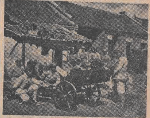
WALKI ARTYLERYJSKIE W YING-PAN

Jeden z wybitnych znawców problemów Azji wschodniej prof. Lattimore, wystąpił przeciwko okazywaniu pomocy rządowi Czang-Kai-Szeka. Czang-Kai-Szek nie zdola opanować obecnej sytuacji w Chinach, gdyż nie cieszy się poparciem narodu chińskiego.