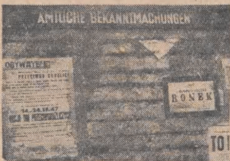
A tablica jak wisiała, tak wisł...

Wszystkie wahania produkcji PZPW — 27 znajdują tutaj swoje odbicie