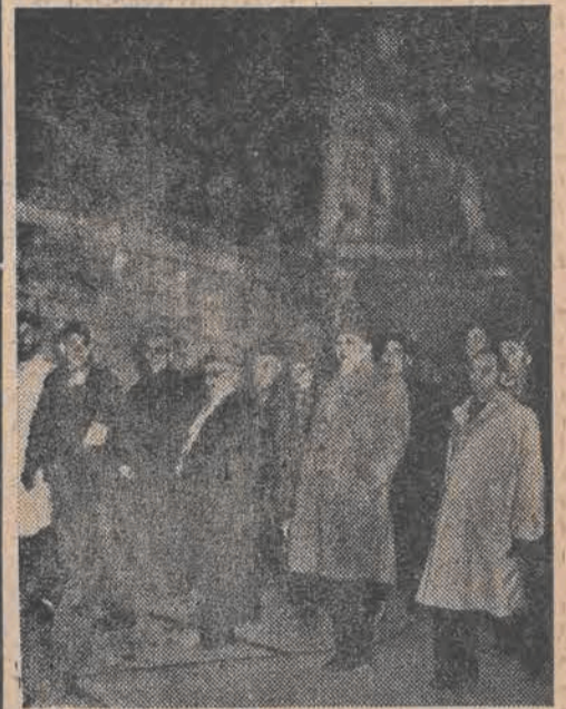
Francuscy posłowie komunistyczni z tow. JACQUES DUCLOS na czele, opuszczają późną nocą gmach francuskiego Zgromadzenia Narodowego po burzliwej debacie w sprawie wyboru wiceprzewodniczących Zgromadzenia.

NOWY JORK PAP. — Oświadczenie prezydenta Trumana, zapowiadające wystąpienie wkrótce w kongresie z wnioskiem o udzielenie dalszej pomocy Chinom, wywołało ożywione komentarze w prasie i opinii publicznej Stanów Zjednoczonych. Grupa znanych działaczy postępowych postanowiła zwołać konferencję, która będzie specjalnie poświęcona polityce Stanów Zjednoczonych wobec Chin i Dalekiego Wschodu.