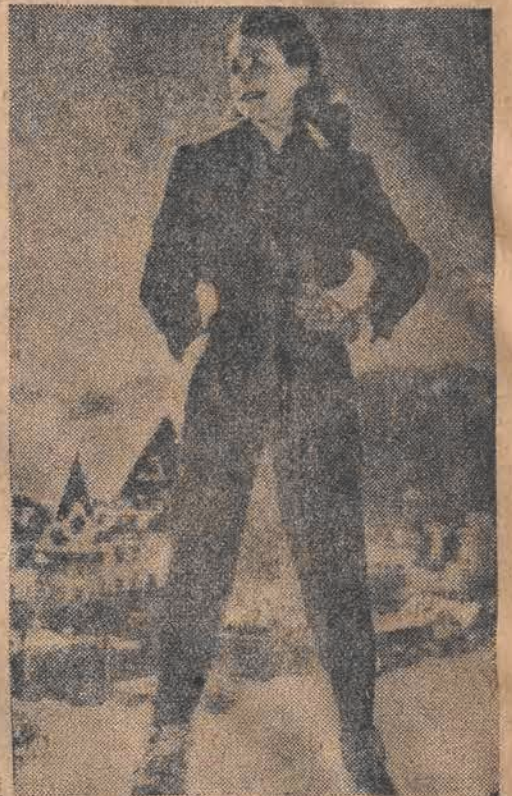
St. Moritz w chwili obecnej jest na ustach wszystkich sportowców świata. Fragment klimatycznej miejscowości w Szwajcarii widzimy na drugim planie. Ale nawet ta uroczą narciarka nie załamie uroku gór i słońca

Reprezentacja hokejowa Polski została ostatecznie zgłoszona do udziału w zimowych