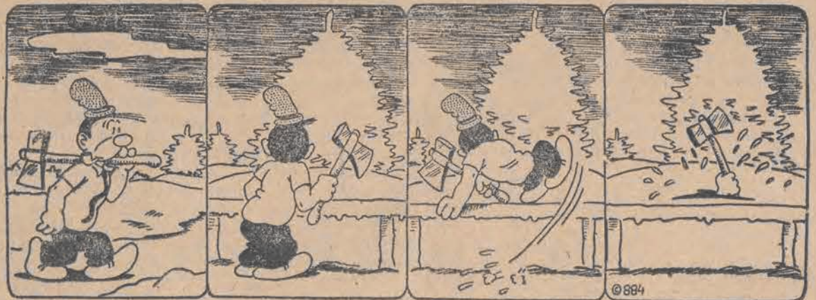
Trzeba drewna narąbać.