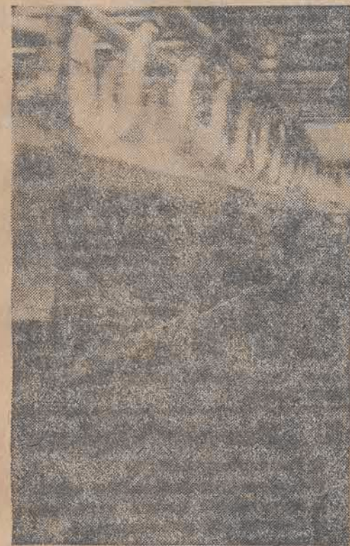
Prześwietlanie illiczek na przedziałni jedwabiu

również, w tej samej mniej więcej proporcji mają zwiększony plan produkcji. Odnosnie jedwabiu, to produkcja jego mogłaby, po dokonanej przebudowie, wzrosnąć do 5 tysięcy t., lecz stoi temu na przeszkodzie brak celulozy.