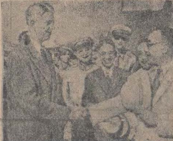
Amerykański „doradca“ Czang-Kai-Sze, gen. Wedemeyer, uśmiecha się rozkosznie do równie zadowolonych przedstawicieli Kuomintangu. Obawiamy się, że nie na zdjęciu miny tego „grona“ nie są tak wesołe, mimo bowiem dostaw broni z USA watahy Czang-Kai-Sze są metodycznie gromione przez chińską armię ludową, zagrażając obecnie już nawet Nankinowi.