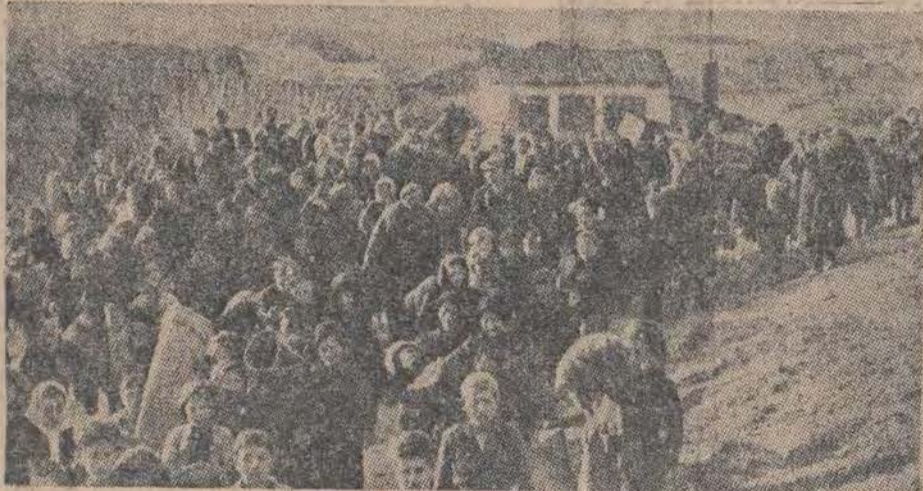
Na wieść o zbliżającym się froncie gen. Marcosa ludność grecka ze wschodniej Tracji, zachodniej Macedonii i innych terenów przyfrontowych przenosi się tłumnie na tereny wyzwolone przez oddziały armii demokratycznej.