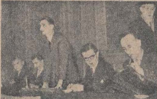
Na zdjęciu — biuro francuskiej „organizacji“ „Force Ouvrière“. Wprawdzie „Force Ouvrière“ tłumaczy się „Siła Robotnicza“, w tym wypadku jednak „force“ oznacza nie tyle „siła“ ile „forsę“, za którą kapitał amerykański kupuje rozłamowców we francuskim ruchu robotniczym.