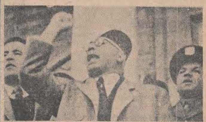
„Przyjaźń 70 milionów Arabów jest ważniejsza dla Stanów Zjednoczonych, niż los kilkuset tysięcy Żydów“, to też nie bez „życiowej wiedzy“ amerykańskich kół wojskowo-politycznych „burzą się“ Arabowie przeciw podzielnemu Ralestinowi.