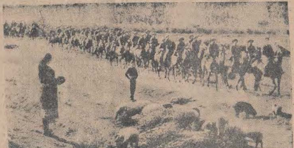
Rządowi żołnierze greccy, których Sophulis „posadził na koni“, są bardzo zadowoleni z przydziału do kawalerii. W ulicznych bitwach okazało się, że przed harnetami Marcosa łatwiej uciekać Sophulisowej konnicy, niż piechocie...