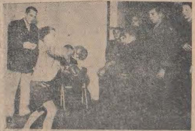
„Demokratyzni“ wykładowcy z akademii gen. Claya nie tylko kształcą i pouczają starego Schumachera, ale również usiłują „szkolić“ t. zw. młody narybek. W ramach tego „programu wychowawczego“ aczą przede wszystkim — bić. (Na razie — w rękawicach bokserkich).