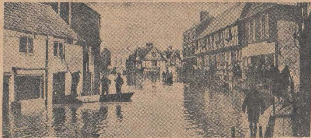
Na skutek długotrwałych deszczów szereg rzek w Anglii wystąpiło z brzegów. Szczególnie silnie wylała rzeka Severn w hrabstwie Shrewsbury i Worcester. Na il. — miasto Shrewsbury pod wodą.