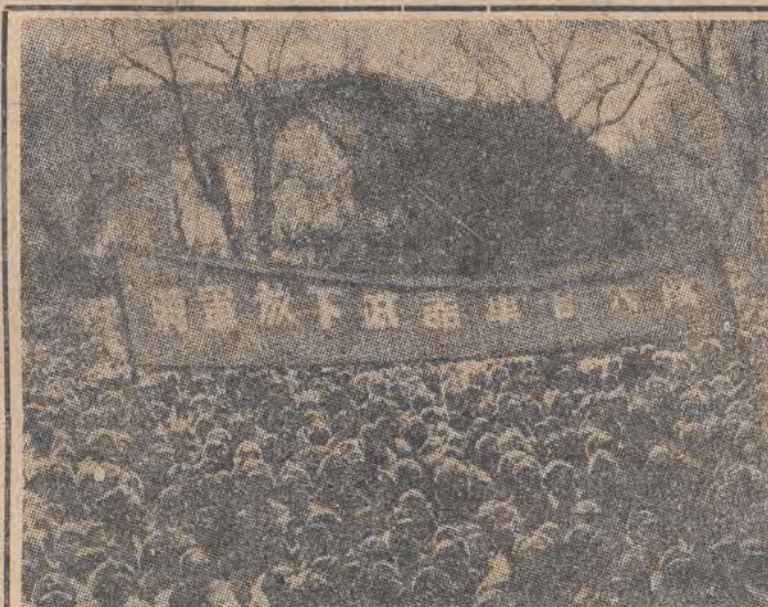
Na terenie części Chin — pozostających jeszcze pod władzą Czang-Kai-Szeka — odbywają się masowe manifestacje ludności miast i wsi. Oburzona ludność domaga się wyrzucenia zaprzędanego koncernom amerykańskim dyktatora-faszysty.

organizację terrorystyczną, która nie dopuszcza do rozwiązania problemów palestyńskich. Creech Jones określił sytuację w Palestynie jako bardzo niebezpieczną i zapowiedział, że wycofanie wojsk brytyjskich z Palestyny wywoła w kraju tym krwawą wojnę domową.