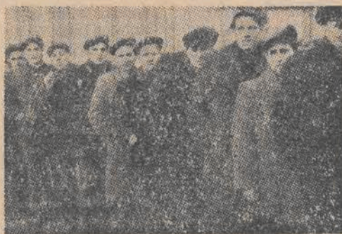
Dyscyplina pracy szwankuje — jeszcze syrena wyje — a w bramie już pełno

Niejednokrotnie już pisaliśmy o osobliwym położeniu w jakim znajdują się robotnicy i kierownictwo Fabryki Pasów Pędnych i Artykułów Technicznych. Maszyny są, rąk roboczych nie brak, robotnicy pracują dobrze, a fabryka chronicznie nie wykonuje planu z powodu ciągłego braku surowca. Nie wykonała go w roku ubiegłym, nie wykonała ani w styczniu, ani w lutym i nie ma widoków, by załoga mogła poszczycić się choćby stu procentami wykonania w przyszłych miesiącach.