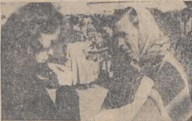
„CZY ABY ŚWIEŻE?”