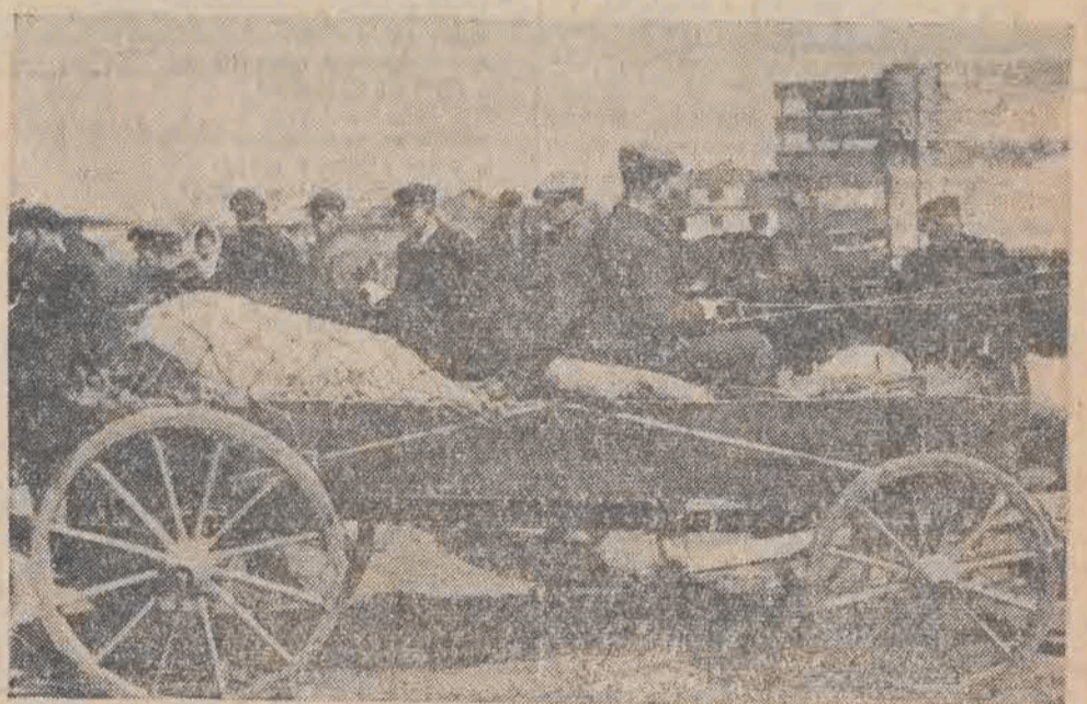
Młasteczko ożywia się bardzo w dzień targowy. Rynek i przylegające doń ulice zapelniają liczne towary i ludzie z „towarem”. Chłop polski sprzedaje i kupuje.