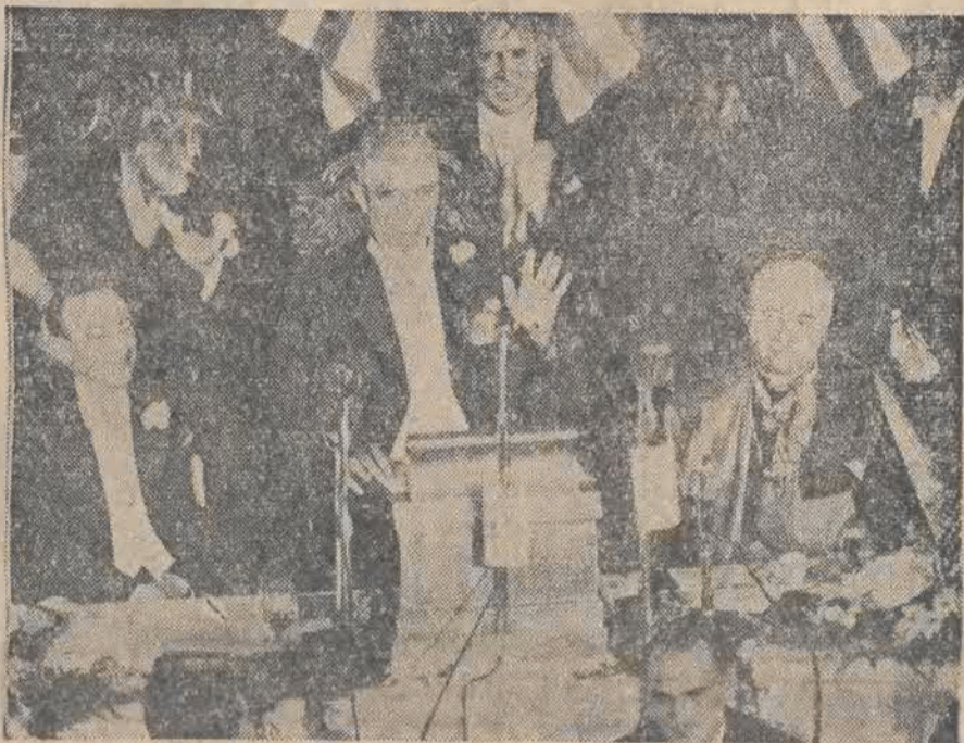
„Łatwiej wielbiłdowi przejść przez ucho igielne, niż bogaczowi wniknąć do Królestwa Niebieskiego”, jeśli chodzi jednak o wejście do Watykanu, to wstęp dla bogaczy (zwłaszcza amerykańskich) jest szeroko otwarty: otwiera go oficjalnie umowa o wymianie usług, jaką ostatnio zawarł Ojciec św. z bankierami amerykańskimi. Celem ściślejszego kontaktu z kapitalistami i podlegającymi wojennymi na ministra spraw zagranicznych Watykanu wyznaczył prez. Truman kardynała z U.S.A., Spelmanna (na zdjęciu — Truman, a obok niego kard. Spelman).