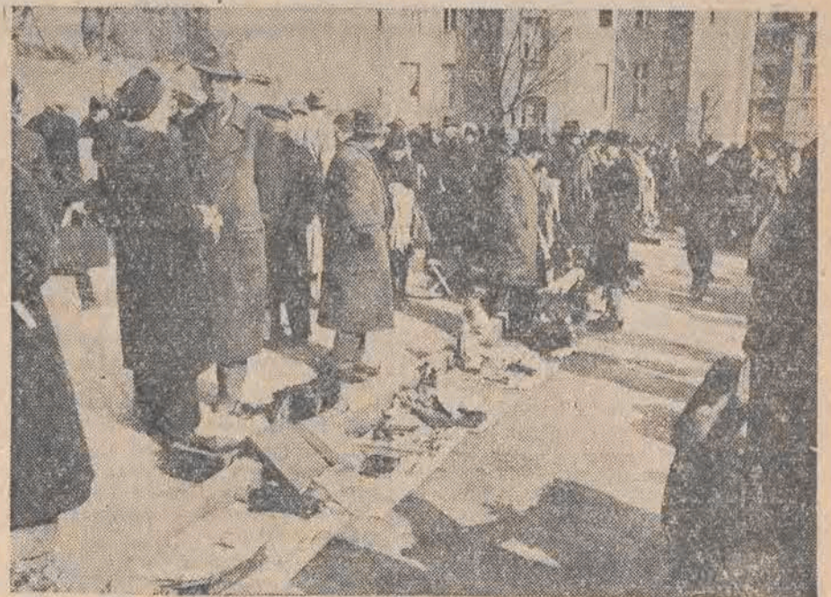
Polityka Anglosasów sprawia, iż w Niemczech nie ma prawie normalnego targu, za to kwitnie wszędzie t. zw. czary rynek. Wielcy czarnogłędziarze dysponują nawet 700 radiowymi stacjami nadawczymi, które w swych audycjach nadają cennik czarnego rynku oraz oferty-kupna i sprzedaży towarów, których brak w normalnym obrocie handlowym. (Na zdjęciu fragment czarnego rynku w Berlinie).