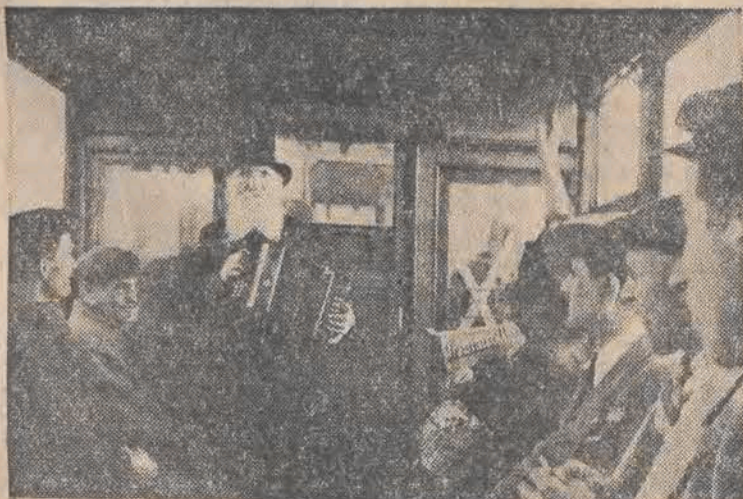
Codzienna podróż do pracy w zatłoczonych wozach ŁWEKD czy PKP nie należy do przyjemności. Wie o tym sędziwy akordeonista i gra na harmonii — w miła czas podróżnym