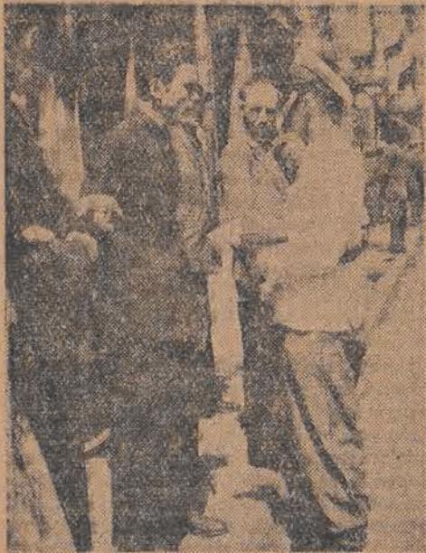
Za nieuwagę i lekceważenie przepisów — mandacik i trzeba zapłacić karę.