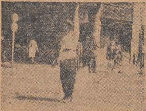
Stop! Sygnał, że nastąpi zmiana kierunku i przechodzić nie wolno.

Łodźianie nie mogą się nauczyć prawidłowego chodzenia i przechodzenia przez ulicę. A ruch w mieście się zwiększa i o wypadek nie trudno. Funkcjonariusze M.O. mają nie mało trosk z wdrożeniem zasad bezpieczeństwa ruchu na ulicach.