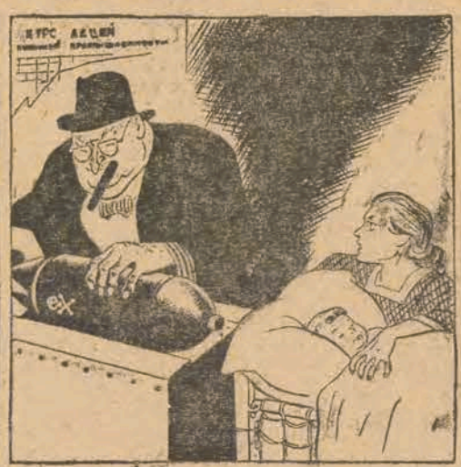
Kołysanka amerykańska Kołysanka radziecka